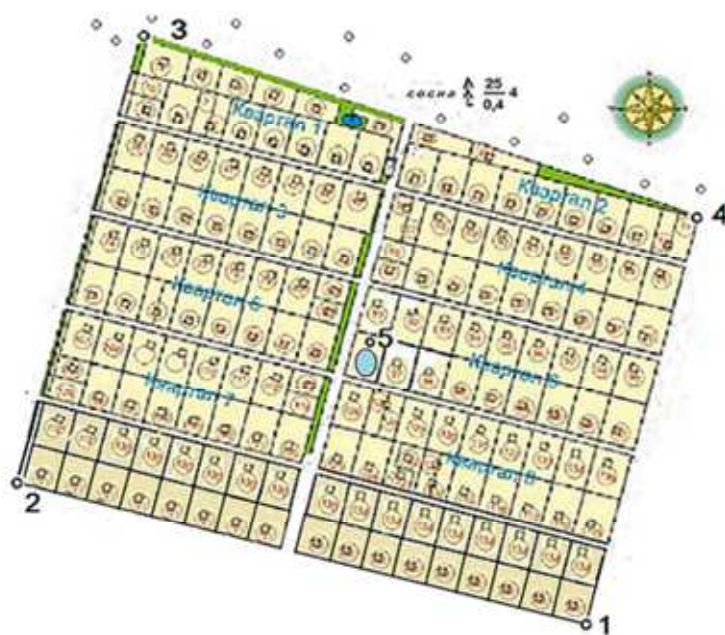
Рис. 2. План садово-городнього товариства

На пунктах 1 та 2 були виконані спостереження з використанням GPS-приймача та визначені висоти і прямокутні координати цих пунктів у системі координат УСК 2000. На пунктах 3 та 4 такі спостереження давали нестабільні результати, оскільки північна частина земельного масиву межувала з сосновим лісом із висотою дерев близько 25 м (рис. 2), що приводило до багатопроменевості сигналу від супутників GPS та створенню додаткових завад. Оскільки всередині земельного масиву розташовувалась водонапірна башта з блискавковідводом, то доцільно використати саме полюсний метод, обравши блискавковідвід за полюс, який позначено на рис. 2 цифрою 5.