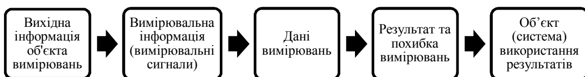
Рис. 1. Послідовність перетворення інформації про об'єкт дослідження

Вимірювальна технологія реалізує проведення процесу вимірювань на базі використання ІС та отримання результату і похибки вимірювань. На рис. 1 наведено послідовність перетворення інформації при проведенні моніторингу енергоефективності будівель та споруд.