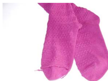
Рис. 3. Невідповідність чинним вимогам панчішно-шкарпеткових виробів за коефіцієнтом товщини шва мискової частини

При сертифікації панчішно-шкарпеткових виробів часто виявляють невідповідність за коефіцієнтом товщини шва мискової частини, який при нормі 1.2 або 1.4 мм (залежно від розміру) фактично може становити 2–3 мм, що призводить до здавлення ніжки дитини під час носіння взуття (рис. 3).