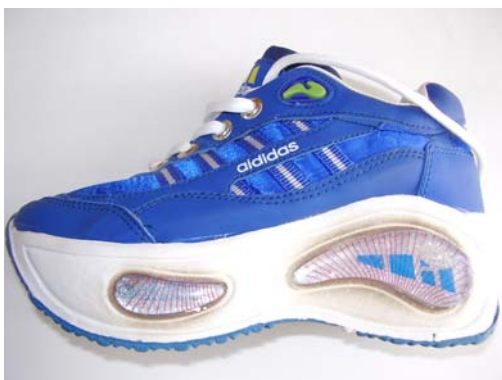
Рис. 2. Контрафактна продукція з використанням бренда Adidas

На жаль, в Україні широко розповсюджена фальсифікація продукції, зокрема у вигляді контрафакції – використання відомої торгової марки, бренда (рис. 2).