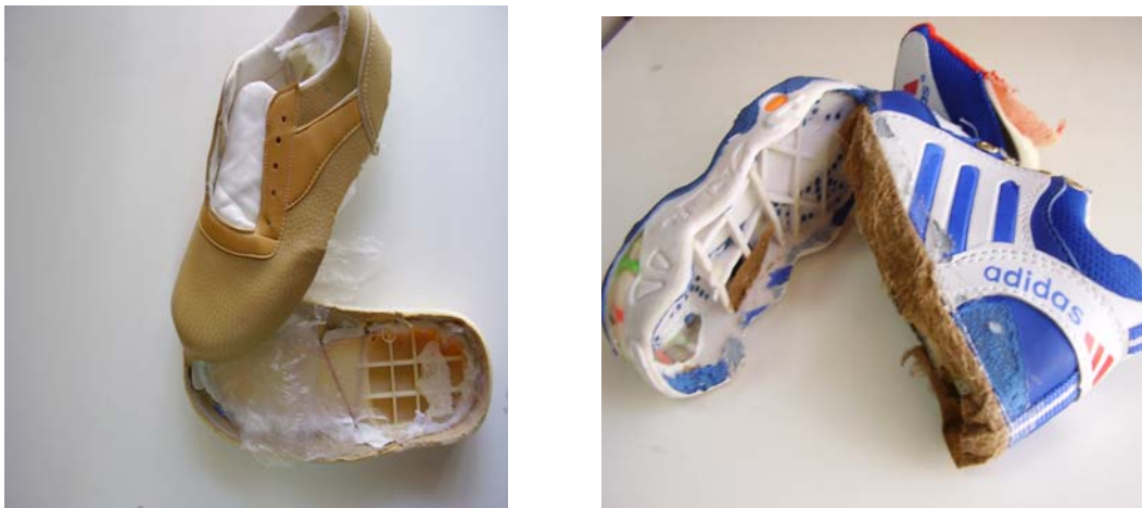
Рис. 4. Невідповідність взуття нормі за міцністю кріплення деталей низу

Під час сертифікації дитячого взуття невідповідність чинним вимогам частіше виявляється за міцністю кріплення деталей низу. Це відбувається внаслідок використання виробником неякісного клею, порушення умов зберігання (рис. 4).