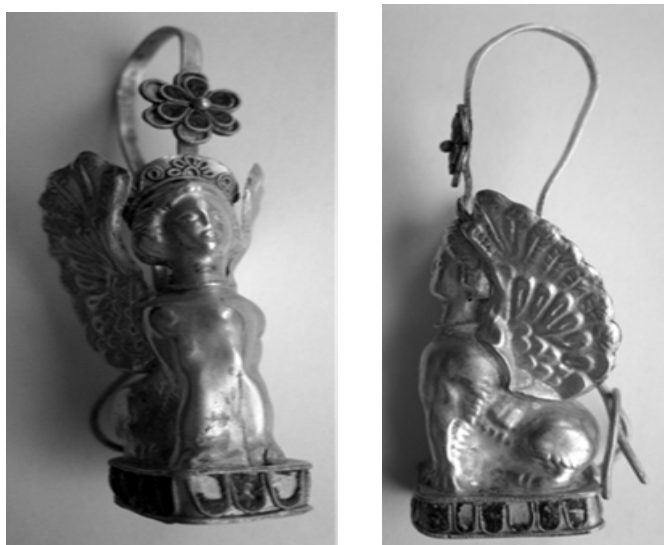
Рис. 2. Зовнішній вигляд сережки "Сфінкс"

Зразок відродженого виробу – золота сережка "Сфінкс" з конструкцією застібки, не характерною для другої половини IV ст. до н. е. (рис. 2).