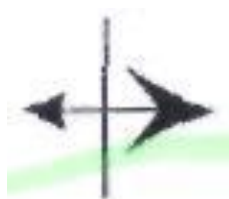
Рис. 1. Приклад чіткого «опорного сигналу»

Наприклад, у викладанні матеріалу з економічних дисциплін про ефективність торгівельних зв'язків України викладач підкреслює, що слід дотримуватись правила переважного вивозу: вивозити за кордон держава повинна завжди більше, аніж завозити. Тільки у такому випадку можливе збагачення, а отже, і зміцнення економіки – грошова різниця між вартістю вивезеного товару буде залишатися на внутрішньому ринку. Про це можна просто розповісти, а можна підсилити сприйняття матеріалу чіткою схемою – «опорним сигналом» (рис. 1).