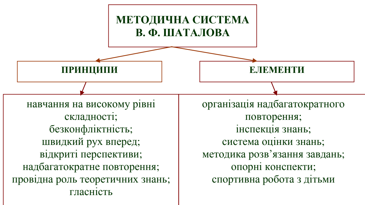
Рис.3. Принципи та елементи методичної системи В. Ф. Шаталова

Навчальні матеріали за методичною системою В. Ф. Шаталова (рис. 3), що викладено головним чином у вербально-графічній формі (у вигляді малюнків, схем), спрощують процес сприйняття і орієнтують на розвиток творчого мислення учнів за принципом відкритих перспектив [3; 5; 6].