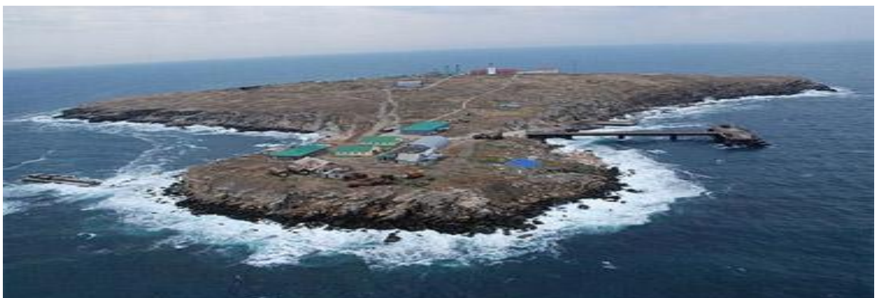
Рис. 1. Острів Зміїний

Острів Зміїний є найбільшим сухопутним утворенням Чорного моря і знаходиться в ІЕЗ України, північно-західній частині моря, за 38 км від дельти Дунаю, 120 км від Одеси і 44,8 км від порту Суліна (Румунія) (рис. 1.). Точне географічне розташування острова – 45^{\circ}15'18'' північної широти і 30^{\circ}19'15'' східної довготи, територія – 20,5 га (0,17 км), 1,97 км по периметру, 615 м в довжину і 300 м завширшки. Найближчий населений пункт України від острова – м. Вилкове (рис. 2).