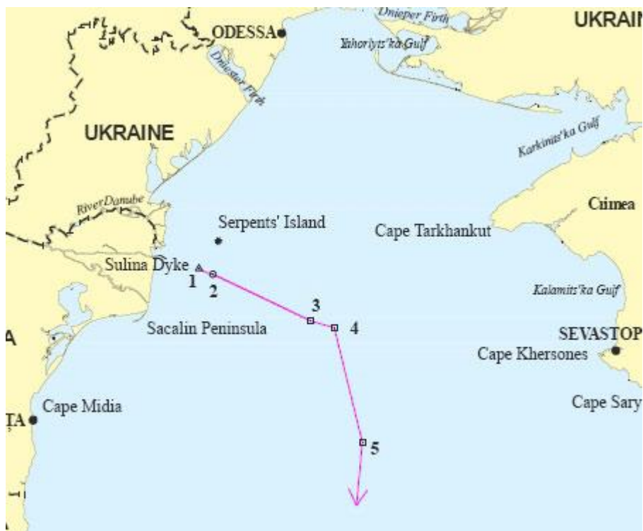
Лінія морського кордону, визнана судом.