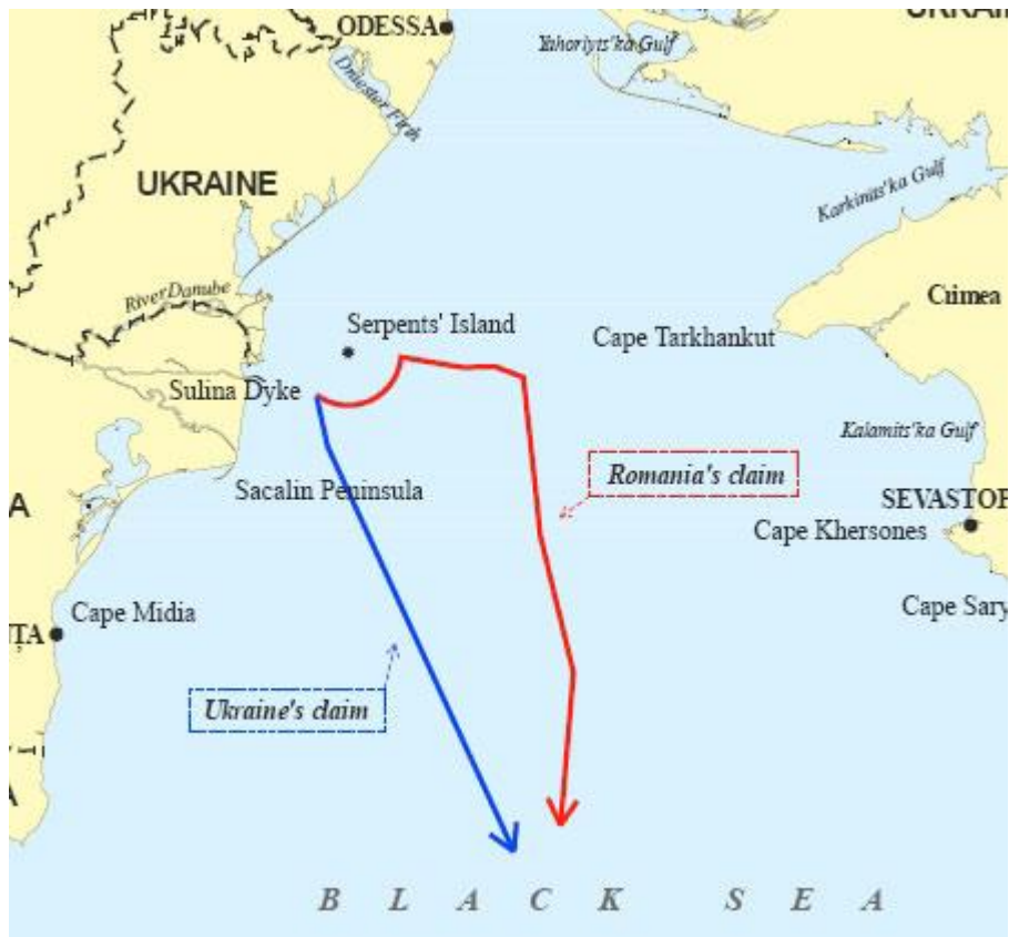
Лінії морського кордону, які вимагали Україна і Румунія