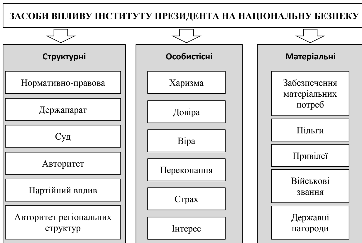
Рис. 1. Структура інструментів та засобів впливу інституту Президента на національну безпеку держави

Зміст, принципи та форми взаємовідносин інституту Президента і національної безпеки представляють різноманітність зв'язків, їх систему, тенденції, стратегічні цілі, визначають вплив на політичний курс, соціально-економічне становище, культуру, гуманітарні й світоглядні аспекти, інноваційний характер прийняття державно-управлінських рішень [8, с. 1].