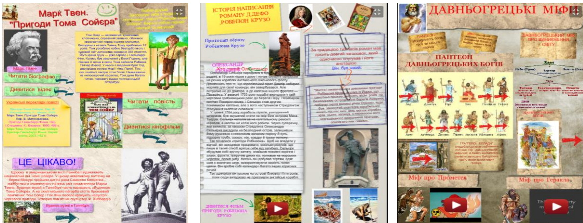
Рис. 2. Приклади інтерактивних плакатів, створених учнями автора статті. Скриншоти.

Інтерактивний плакат можна використовувати не на одному, а протягом декількох дистанційних уроків. У створенні плакатів можуть брати участь і учні (рис. 2).