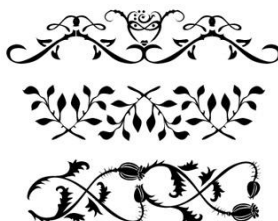
Рис. 5. Ю. Гордон. Орнаментальные сетки для проекта «Цветы зла», Россия, 2007.

Яркий пример тому – серия гарнитур известного российского дизайнера Ю.Гордона под общим названием «Цветы зла». Эти шрифты, помимо алфавитных знаков, включают растительные орнаментальные элементы в духе декаданса. В композиции они создают несколько гнетущую атмосферу, передавая настроение стиля (рис. 5).