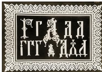
Рис. 2. Иллюстрации из книги К.Д. Далматова "Сборник старинно– русских и славянских букв, заставиц и каемок" (1895 г.)

С самого начала книгопечатанья в Европе политипажи нередко вырезали и отливали специально для дополнения определенных шрифтов, ярким примером тому являются первые флероны, рамки и виньетки (рис. 2). Сегодня же декоративные дополнения к шрифтам разрабатываются дизайнерами во всем мире.