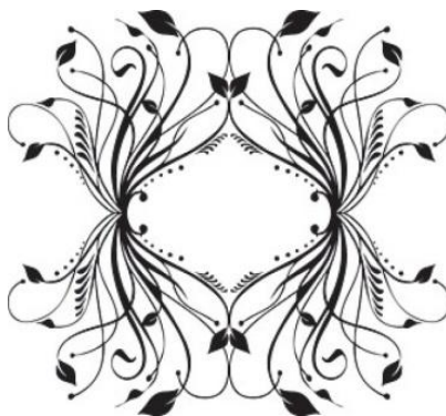
Рис. 1. Пример современных цифровых орнаментов

Если во времена первопечатников доминировали политипажи в виде растительных буквиц и виньеток, в эпоху ампира преобладали цветочные вазоны и оружейные мотивы, если художники–конструктивисты создавали геометричные и лаконичные политипажи то современные акцидентные шрифты вобрали практически все стили и виды политипажа от традиционных до современных (рис. 1).