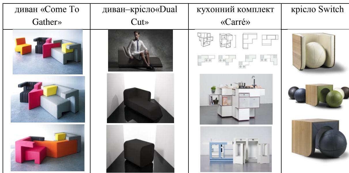
Рис.2 Меблі-трансформери із застосуванням модульності

Стіл-розкладушка «Changeable». Із невеликого табурету із внутрішньою полочкою здатен трансформуватися в столик або стул зі спинкою. Він демонструє практичність та раціональність у використанні. Завдяки елементів конструктивів він легко змінює форму та є зручним у експлуатації. У конструкторі, в якому немає уніфікаційного зв'язку елементів, кожен з яких призначений для формування лише свого вихідного виробу, по суті перестає бути конструктором як таким, так як його елементи не мають вихідних ознаково-можливих організацій гнучких і динамічних, трансформуються морфоструктурою, що мають можливість змінювати свої інструментальні функції. Велику роль у функціональності трансформуючих меблів, та об'єктів дизайну в цілому відіграє модульність (рис.2).