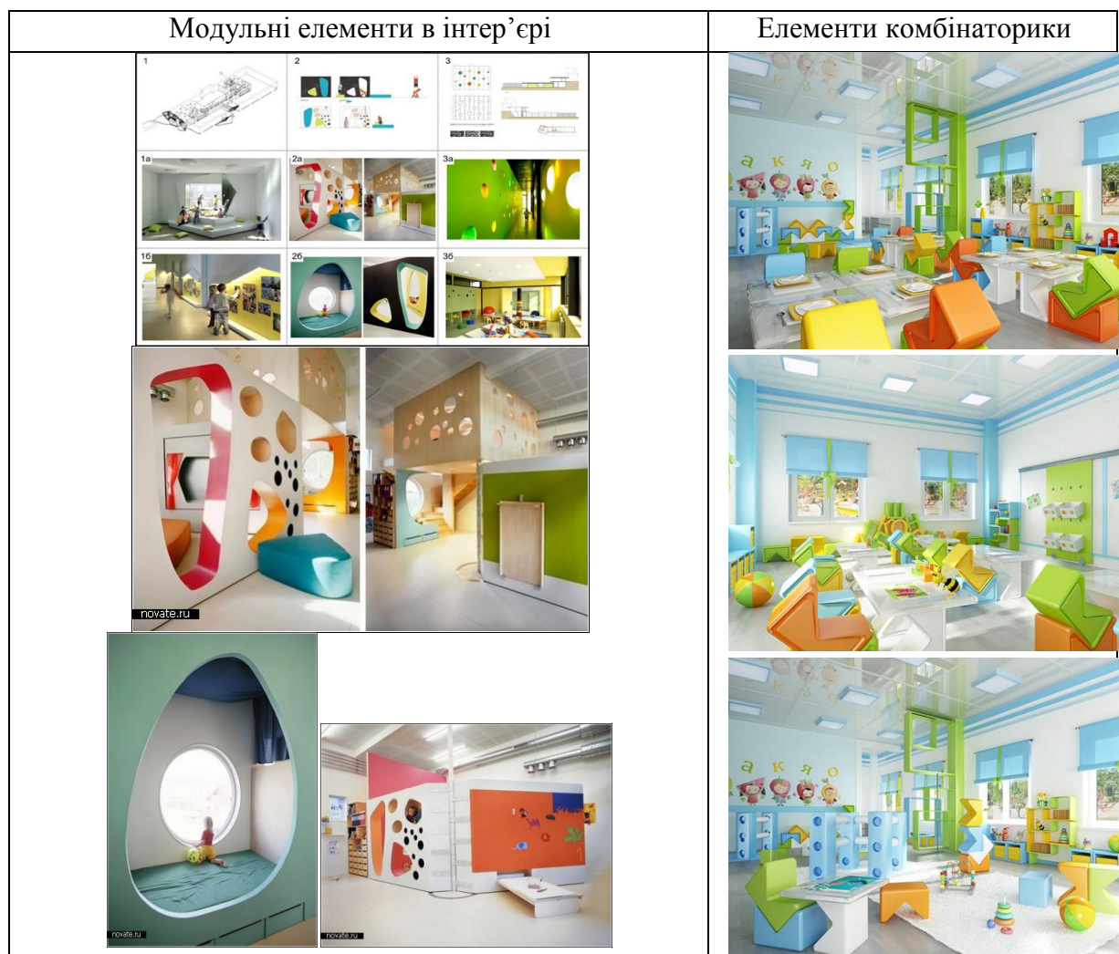
Рис.3. Використання елементів комбінаторики та модульності в трансформуючих об'єктах дизайну інтер'єру.

об'єктів: меблів, інших предметів наповнення інтер'єру легко виправити даний недолік, за рахунок змінення форми, різних варіацій та комбінацій [рис.3].