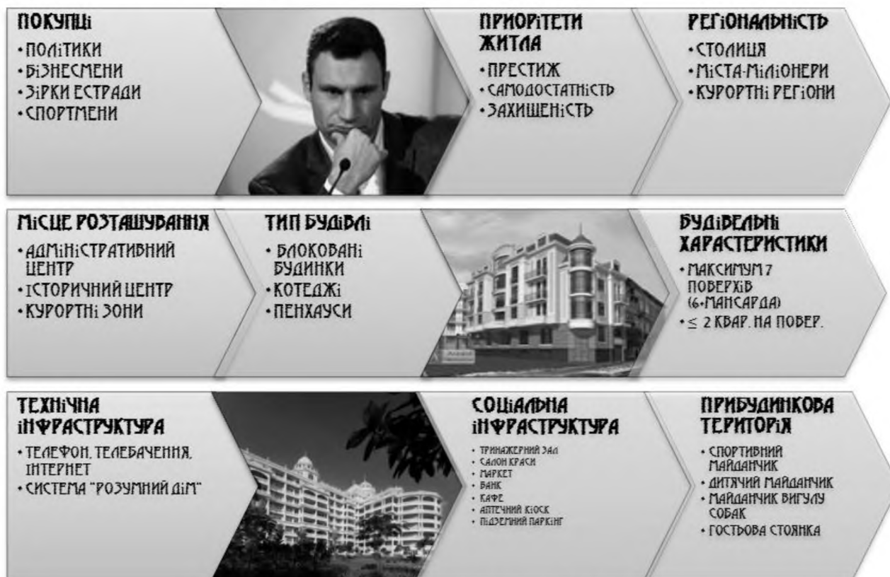
Рис 3. Особливості житла «De lux»

Елітні квартири орієнтовані на дуже багатих людей. Цим пояснюється невелика частка дорого житла в загальних обсягах будівництва 10-12%. Нерухомість категорії «De lux» характеризується наступними особливостями (рис 3), вони найбільше імпонують психотипу «егоїст».