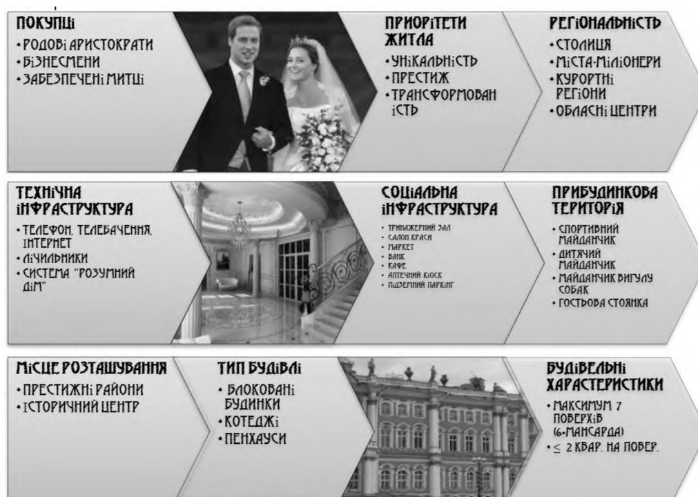
Рис. 4. Особливості житла «Premium»

Категорія «Premium» відзначається наступними особливостями (рис.3), вони найбільше імпонують психотипам «споглядач» та «борець».