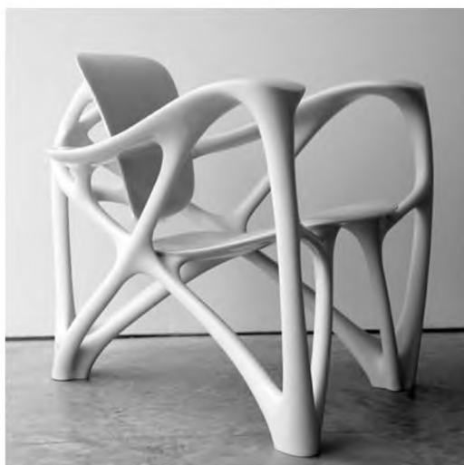
Рис. 4 Стілець з елементами деконструкції

Другою засадою, що була виділена у деконструктивізмі авторами статті, є принцип деконструкції як засіб творення композиції. Деконструкція використовувалася іншими стилями, але саме в аспекті дихотомії з хаосом вона набуває іншого трактування. Особливість деконструкції в стилі «деконструктивізм» полягає у тому, що цей принцип творення виступає на перше місце, а всі інші можливі варіанти взагалі відсутні. Тобто даний стиль деформує конструкції, площини, форми тощо, піддаючи об'єкти цілковитій реконструкції. З рис. 4. на прикладі промислового дизайну (провідні дизайнери Р. Мутш, А. Гедда) видно, що описана засада є основною в стилеутворенні деконструктивізму. Оскільки елементи стільця мають зруйновану форму внаслідок її деконструкції.