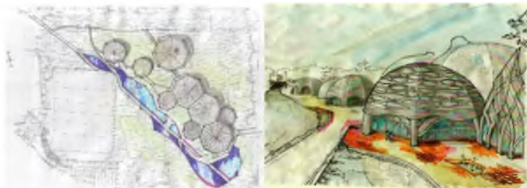
Рис. 4. Реконструкція парку в с. Крюківщина, Київська область. Ескізи пропозиції, арх. Ю. Третьак, 2016 р.

Висновки. Основними закономірностями формоутворення у галузі органічного дизайну виступають принципи редуції, ієрархічності та еволюційності. Впровадження кожного з цих принципів у практику проектування в свою чергу пов'язано з використанням відповідних інструментів – найсучасніших засобів і прийомів, що дозволяють створювати й гармонізувати об'єкти як живі організми.