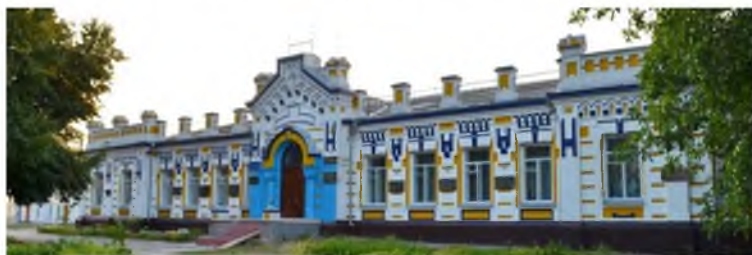
Рис.5. Богадільня 1907 – 1908 рр. в с. Германівка.