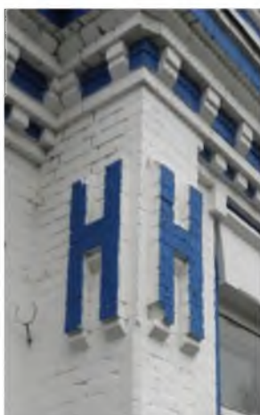
Рис.3. Літера «Н» на фасадах богадільні та двокласного училища