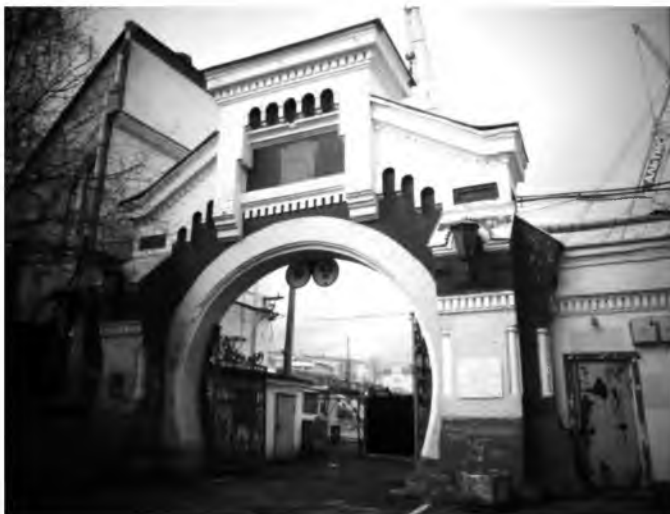
Рис. 1. Брама колишнього казенного винного складу на Деміївці. 1897.