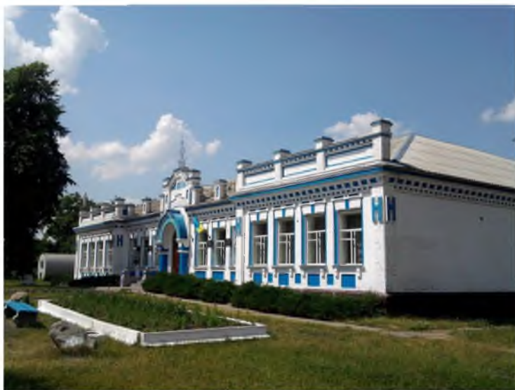
Рис. 2. Двокласне училище (гімназія) 1909 р. в с. Германівка.