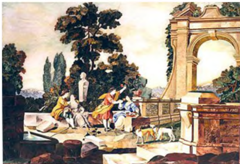
Рис.1. Композиція в техніці «Pietre dure». Італія. XVII ст.