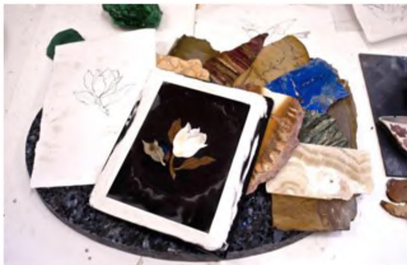
Рис.2 Рисунок та матеріали.