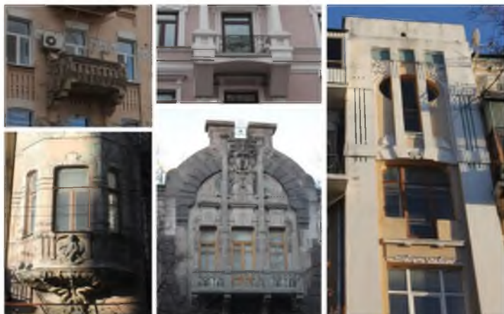
Рис. 4. Пластичне вирішення лоджій, еркерів, аттиків, балконів.

Певна кількість будівель втратила свою первинну красу та стилістичну єдність внаслідок втрати деталей та важливих елементів фасаду, а також значного спрощення внутрішньої структури та навіть форми вікон (рис. 5).