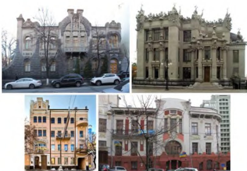
Рис. 1. Будинки з асиметричною композицією у стилі модерн.

Однією з основних стилеформуючих рис модерну є круглі, напівкруглі та підковоподібні вікна й двері. Їх розміри і форми примхливо змінюються, що створює враження витвору природи (рис. 2). Притаманна модерну живописність та пластичність фасаду досягається за рахунок виразного силуету будівлі, використання скульптури в завершеннях будівель, сильного виносу карнизів на кронштейнах.