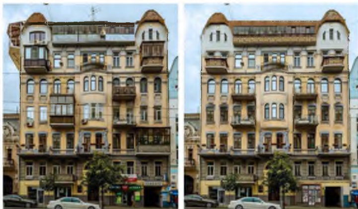
Рис. 8. Будинок за адресою Сакаганського, 99 до і після запропонованої авторами реставрації

Висновки. Для збереження художньої цінності споруд і міста в цілому треба повернути фасадам в стилі модерн їх первинний стан і образ, зберегти, а в деяких випадках відновити архітектурні та декоративні елементи, а також первісно існуючу