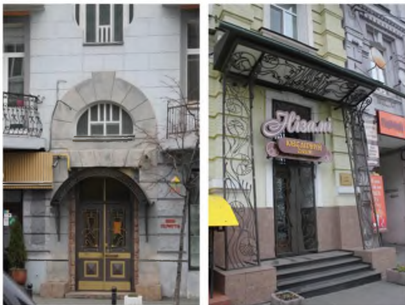
Рис. 6. Сучасні входні групи у стилі модерн.

Дуже незначна частина підприємців намагається при цьому урахувати цінність історичної споруди і не зіпсувати її. (рис 7). Проаналізувавши споруди за адресою Воровського, 19 та Саксаганського, 99, було виявлено, що за час свого існування вони суттєво змінилися в гірший бік, через “осучаснення” фасаду мешканцями будинку: склопластикові конструкції не відповідають структурі первісних вікон і дверей, а добудовані балкони на фасаді Саксаганського, 99 псують симетричну композицію споруди і нагадують голубники.