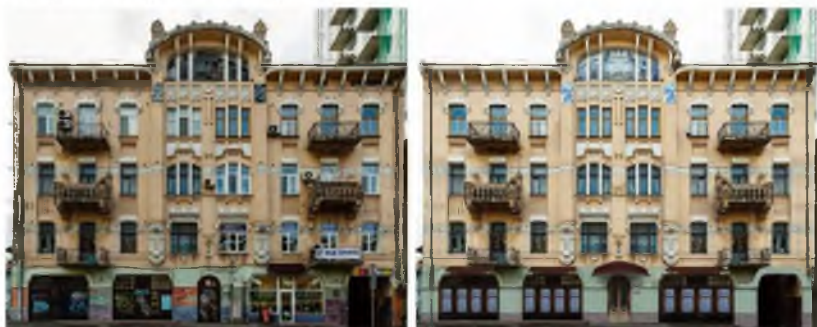
Рис. 7. Будинок за адресою Воровського, 19 до і після запропонованої нами реставрації.

створено наглядний приклад того, як би виглядали ці споруди у разі їхньої реставрації, повернення елементів і демонтажу добудов та реклами. (рис 7, 8)