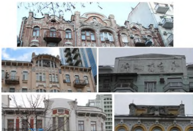
Рис. 3. Скульптурні завершення споруд за адресами: Городецького 15, Воровського 19, Горького 26, Олесь Гончара 33, Ветрова 17.

В оформленні фасадів широко застосовувалися декоративні елементи: галереї з балюстрадами, дерев'яні балки та гнуті рами, тераси, об'ємна скульптура, барельєфні фризи, міжвіконні та підвіконні вставки з розвиненою декоративною пластикою. Скульптури на фасадах були не просто прикрасою, вони утворювали складні символічні сценарії і виконували функцію оберегів будинку.