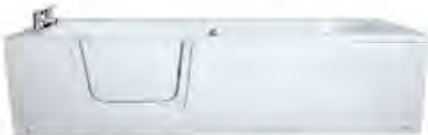
Рис. 1. Ванна для інвалідів з дверцятами

У [4], за кордоном, запропоновано ванну для інвалідів із дверцятами (рис.1), та ванна для інвалідів сидяча (рис.2, а), звичайна ванна «Rosa PRINCESSA 170» (рис.2, б).