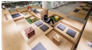
Рис.7. Різномірівнево-сходовий офіс