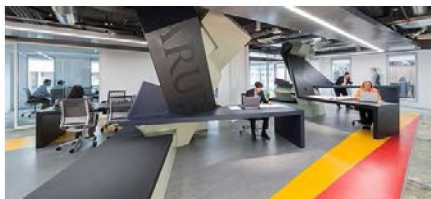
Рис.6. Тачдаун офіс