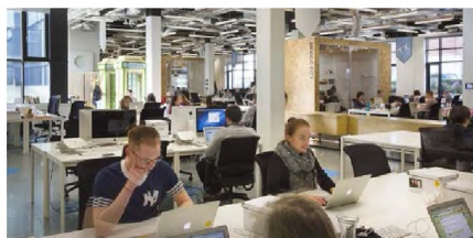
Рис. 4. Кластерний підтип компонування функційних зон