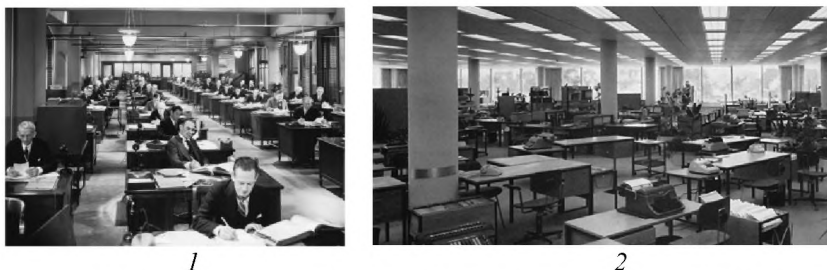
Рис. 3. Класична приватно-індивідуальна організація простору працівника: 1 – фабрична; 2 – бюроландшафт.