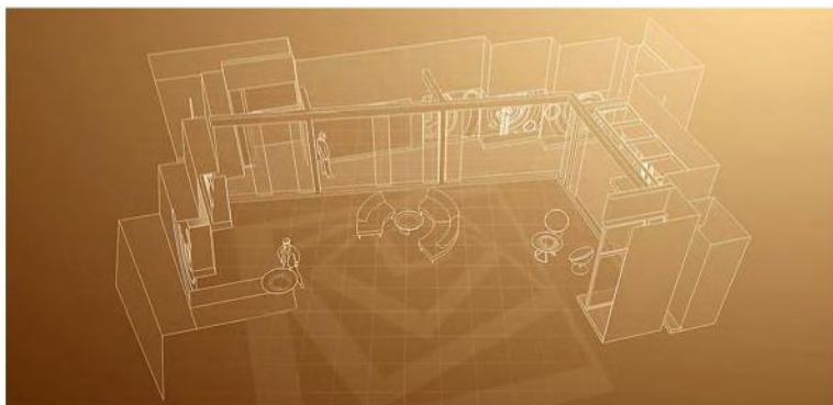
Рис. 4. Об'ємно-просторова організація телестудій ТВЦ «Настрій»

Варто зауважити, що у кінці ХХ ст., як правило, в одній класичній студії комбінують кілька підвидів об'ємно-конструктивної організації. Наприклад, програма телеканалу ТВЦ «Настрій»: у побудові об'ємно-конструктивної форми декорацій телестудій зосереджено відразу три функціональні зони – дві побутові і одна дикторська, що надає різноманітні плани і комбінації при зйомках (Рис.4).