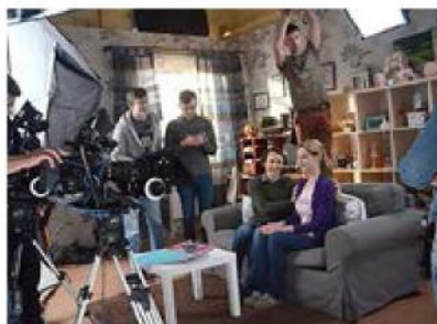
Рис. 3. Побутовий тип об'ємно-конструктивної організації