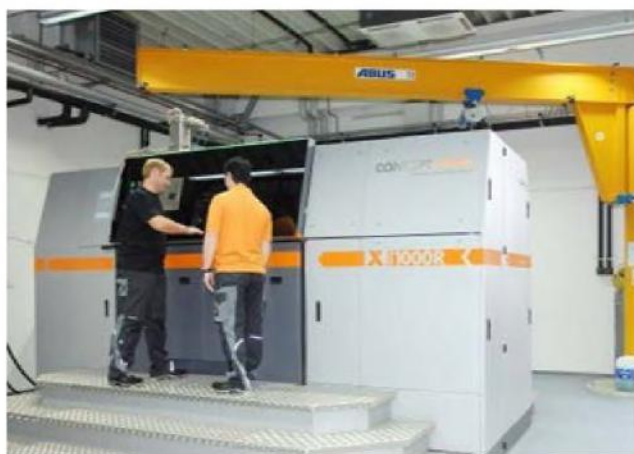
Рис. 2. Металевий 3D-принтер Concept Laser XLine 1000

У цьому матеріалі гармонійно поєднуються найдрібніші частинки металу, вода та органічне сполучення. Виріб формується, після чого обпалюється. Застосовується даний матеріал, наприклад, при створенні скульптур чи ювелірних виробів. При обпаленні сполучна речовина і вода вигорають, що перетворює металевий порошок в монолітний об'єкт.