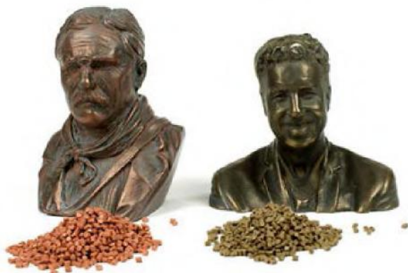
Рис. 4. Отримані шляхом 3D-сканування бюсти

У роботі [5] розглядається один із способів отримання друкованих моделей – сканування вже існуючого об'єкта, а потім його відтворення. 3D-сканери отримують геометрію фізичного об'єкта, роблячи сотні тисяч вимірів. Зазвичай результатом 3D-сканування є полігональна сітка. Відомо, що виливання скульптором бюста в бронзі - досить дороге і клопітке заняття. Існує рішення простіше, дешевше і багатого в чому краще. На сьогодні є можливим відсканувати будь-яку поверхню, включаючи людське обличчя (рис.4).