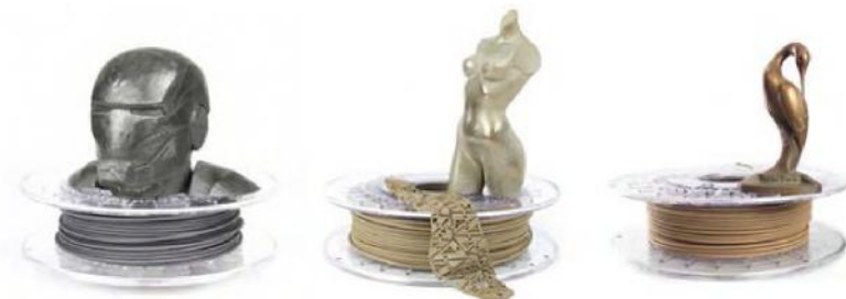
Рис. 1. Котушки філаменту для металевого 3D-друку

1990 році в Японії. Тоді його використовували для ліплення примітивних форм. У промисловості застосовувати його стали лише через десять років після відкриття.