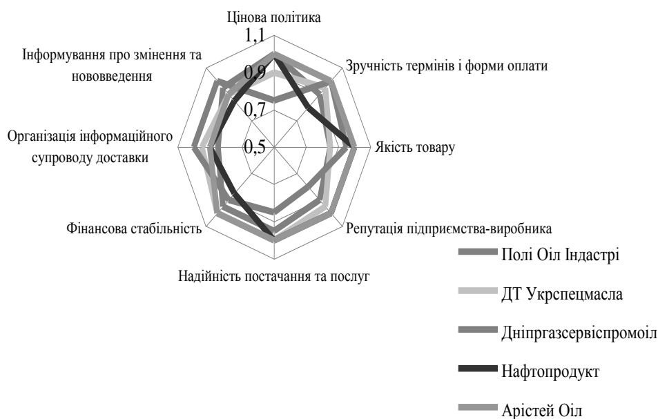
Рис. 2. Графік складових рейтингів підприємств з виробу паливно-мастильних матеріалів

Розглянемо вихідні дані щодо задачі оптимізації постачань на базі системи управління запасами. Визначимо інтенсивність споживання продуктів. Для цього визначимо середню кількість споживаних продуктів за статистичними даними компанії. Розглянемо статистичні дані (табл. 2).