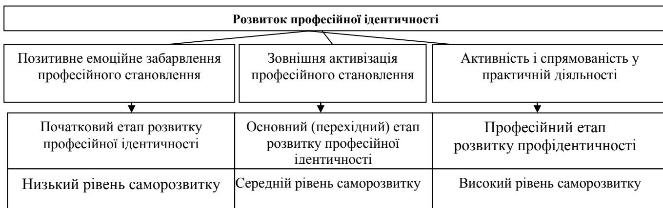
Рис. 2. Модель розвитку професійної ідентичності учнів в умовах навчання у ПТНЗ (на основі фактору саморозвитку)

На професійному етапі розвитку профіидентичності поряд із чинником активності і спрямованості в практичній діяльності знову виявляється пряма кореляція також із чинником емоційного забарвлення професійного становлення. Відмінність полягає в тому, що на початковому етапі позитивні емоції виникають від оволодіння простими робітничими навичками та вміннями, а на завершальному – від здійснення високопрофесійних, творчих дій.