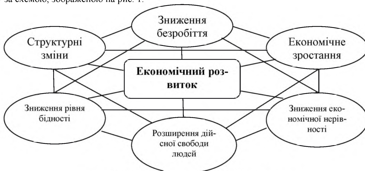
Рис. 1. Основні компоненти економічного розвитку.

Ураховуючи наведені вище визначення, можна сформулювати суть економічного розвитку за схемою, зображеною на рис. 1.