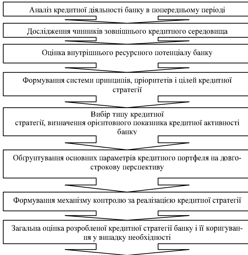
Рис.3. Організаційна модель формування і реалізації кредитної стратегії банку

Огляд наукових досліджень циклічного розвитку економіки [6] вказує на необхідність поступового переходу банківських установ на режим врахування коливань економічної активності суб'єктів, що дозволить попереджати управлінські рішення і своєчасно використовувати організаційні методи забезпечення кредитної стратегії, допомагаючи звести до мінімуму ризику і максимізувати ринкову вартість банку. Недовіра потенційних клієнтів до банківської системи протягом прояви фінансової кризи не дозволяє банкам формувати ресурсну базу і уповільнює процес власного розвитку. У той же час, тільки клієнти обирають банк та кредитні продукти, змушуючи кредитні установи здійснювати моделювання кредитних відносин заздалегідь і захистити їх подальший розвиток.