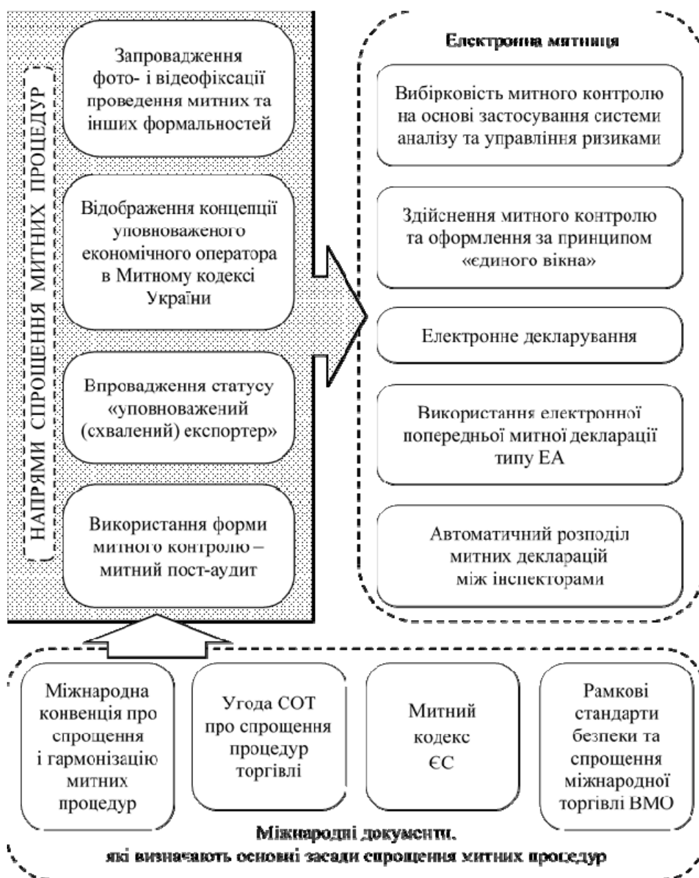
Рис. 1. Шляхи підвищення ефективності митного регулювання, визначені митним законодавством України