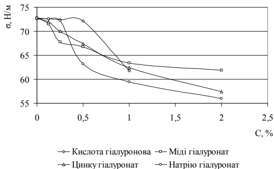
Рисунок 2. Порівняльний графік залежності поверхневого натягу ( \sigma ) від концентрації (C) КГ та її похідних

Вивчення поверхневого натягу водних розчинів показало, що критична концентрація міцелоутворення знаходиться в межах 0,25-1,0 % для всіх речовин, що досліджувались.