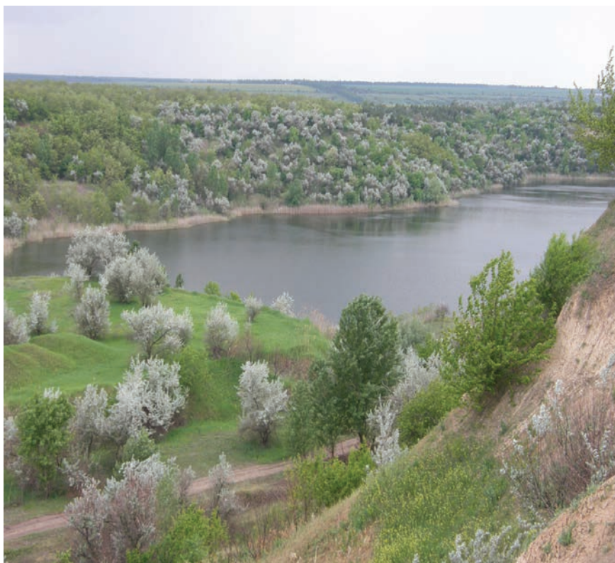
Рис. 2. Заліснені відвали і водоймище на внутрішніх відвалах розрізу «Головківський».

розрізів. Актуальними є заходи щодо формування проточного режиму техногенних водоймищ у залишкових гірничих виробках розрізів та розчистки замулених ділянок р. Інгулець та її притоків в Олександрійському, Ватутінському та Коростишівському гірничо-промислових районах.