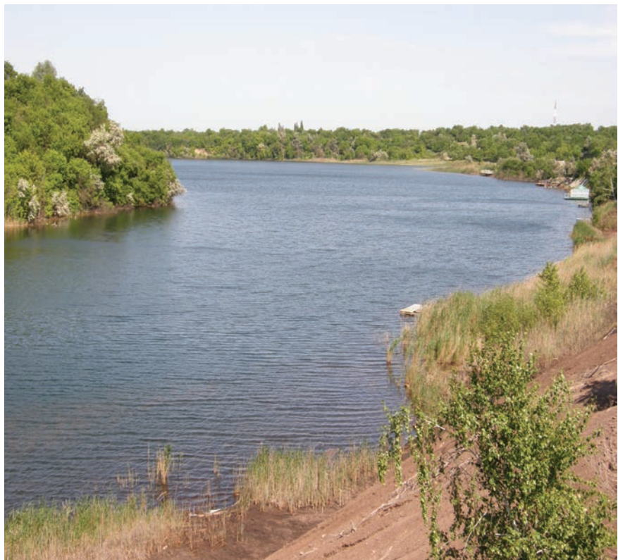
Рис. 3. Рекреаційна зона на залишковій розрізній траншеї та внутрішніх відвалах розрізу «Байдаківський».

Поверхня відвалів, як правило, складається із трьох ярусів, висота ярусу 7–20 м. Поверхня ярусів представлена відносно площинними ділянками, що перемижуються з ямами та навалами порід.