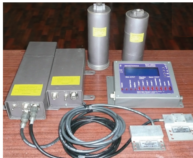
Рис. 3. Опытный образец комплекса КТС шахтной подъемной установки.