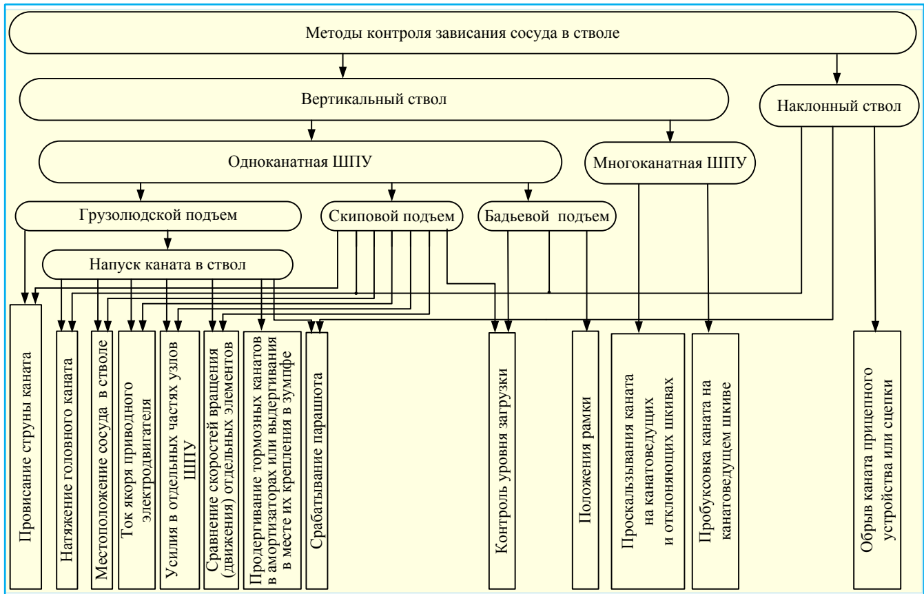
Рис. 1. Методы контроля зависания сосуда в стволе.

личные силоизмерительные и деформационные датчики, а также датчики наклона, которые монтируют на канат выше прицепного устройства. Активные датчики наклона каната, построенные по инерциальным принципам (гироскопы и акселерометры), хорошо зарекомендовали себя по показателям надежности, достоверности и способности в реальном времени выдавать сигнал о текущем наклоне каната в градусах.