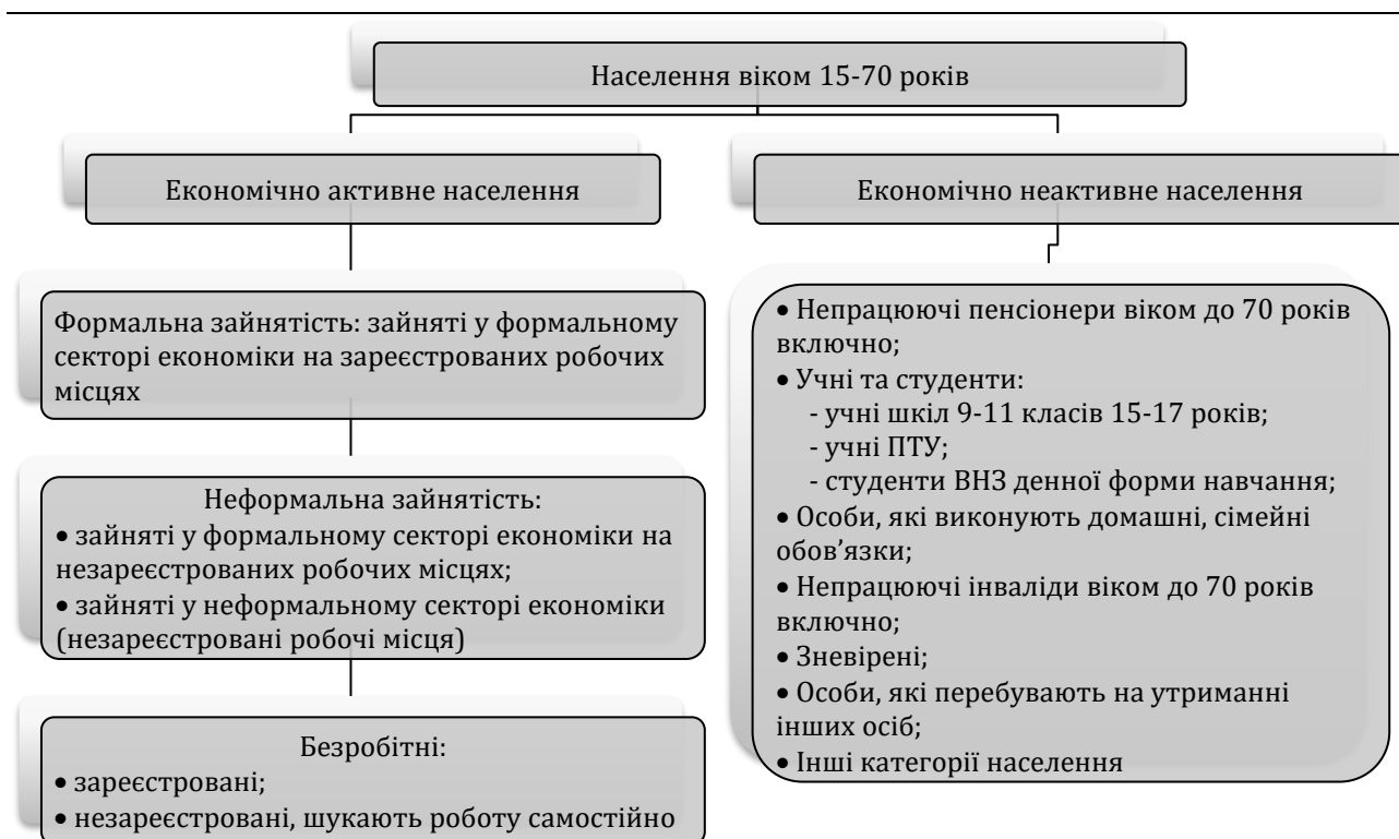
Рис. 2. Розподіл населення регіону за економічним та юридичним статусом на ринку праці

Так, проблема обліку зайнятих за місцем реєстрації (постійного проживання). Пенсійний Фонд України та Державна фіскальна служба України здійснюють облік зайнятих у статусі найманих працівників за ознакою юридичної адреси підприємства, де працює наймана особа.