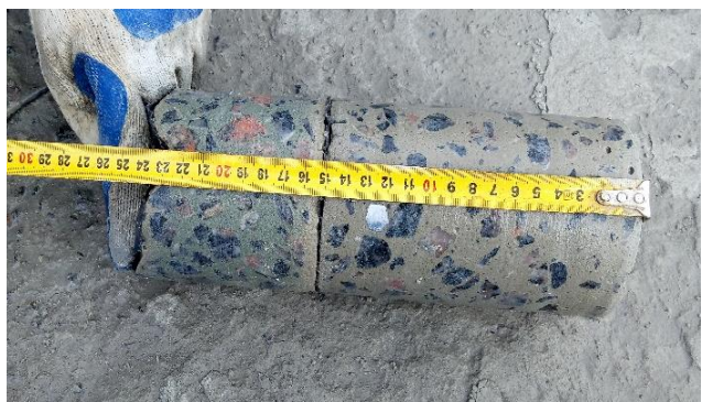
Рис. 4. Відібраний керн

Зразки відбирали як на ділянках із пошкодженою бетонною поверхнею, так і без пошкоджень.