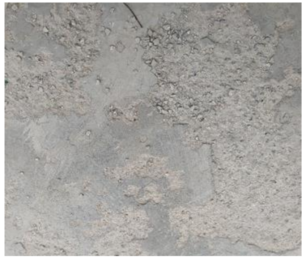
Рис. 2. Пошкодження бетонної поверхні досліджуваної ділянки

Для вивчення властивостей бетону пошкодженої ділянки відібрали зразки кернів (рис. 3 та 4).