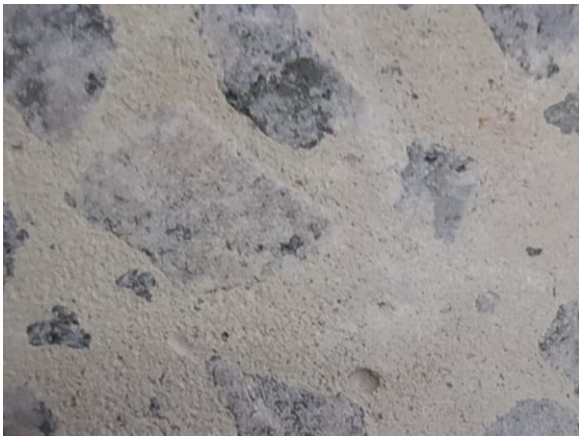
Рис. 6. Цементно-піщана складова бетону керна