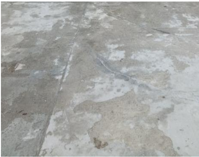
Рис. 1. Ділянка пошкодженого бетонного покриття

Виклад матеріалу. Дослідження проведене в умовах реального об'єкта. Під час експлуатації (9 місяців із моменту укладення бетонної суміші) виявлено ділянки бетонної поверхні з дефектами (рис. 1). Пошкодження мають локальний характер та характеризуються злущенням верхнього шару поверхні (рис. 2).