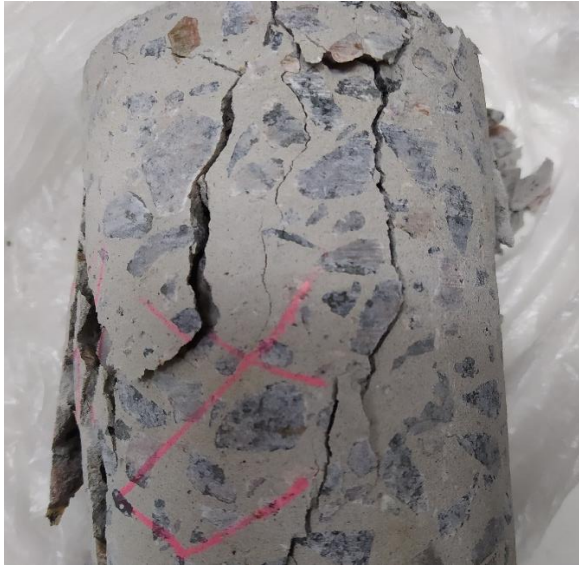
Рис. 10. Характер руйнування зразка підготовленого до випробувань за стандартною методикою

Рисунок 11 демонструє характер руйнування зразків підготовлених до випробувань за допомогою ремонтної суміші Maregrout Thixotropic.