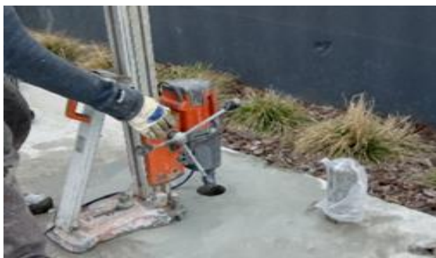
Рис. 3. Відбір кернів

Для вивчення властивостей бетону пошкодженої ділянки відібрали зразки кернів (рис. 3 та 4).