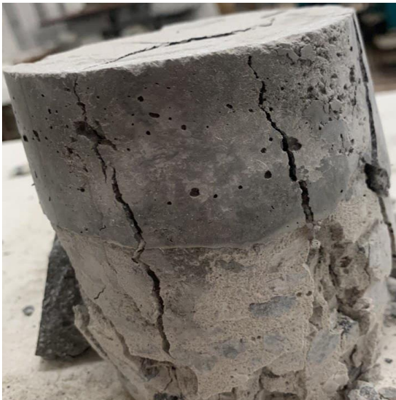
Рис. 11. Характер руйнування зразка підготовленого до випробувань за допомогою ремонтної суміші Maregrout Thixotropic

Рисунок 11 демонструє характер руйнування зразків підготовлених до випробувань за допомогою ремонтної суміші Maregrout Thixotropic.