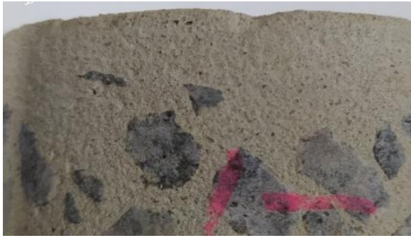
Рис. 5. Верхня зона керна