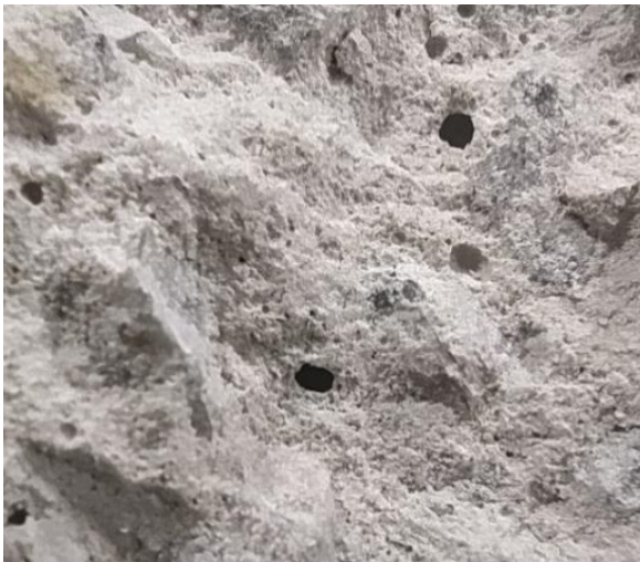
Рис. 7. Порова структура бетону зразка

Із відібраних кернів підготовлено зразки відповідно до вимог [5]. Для більшості зразків цих вимог дотримано. Однак три зразки випробувати за нормами не вдалося. Для двох зразків неможливо було забезпечити нормативний інтервал співвідношення висоти зразка до його діаметра. Зменшення діаметра керна