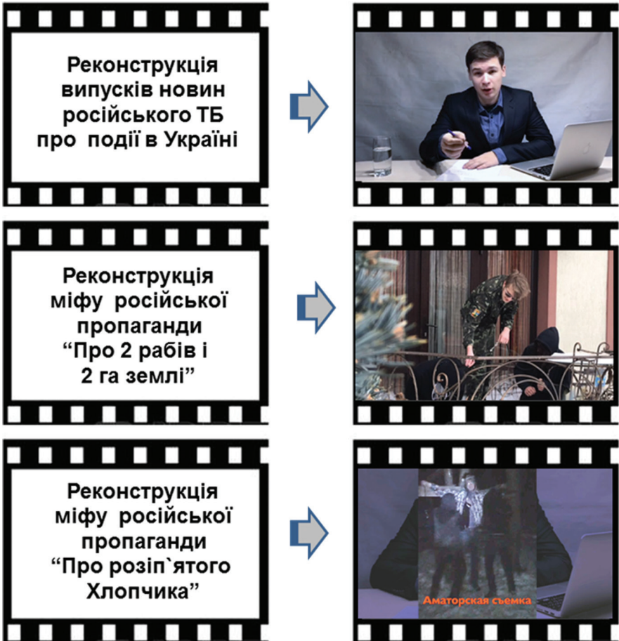
Рис. 2. Кадри з фільму «Думай головою!», створеного учасниками тренінгу на основі коміксу.

через випуски новин. Окрім того, вони реконструювали широко відомі міфи російської пропаганди (міф «Про 2 раби та 2 га землі», які нібито обіцяні як нагорода українським солдатам, міф «Про розп'ятого хлопчика», який нібито став жертвою українських солдат).