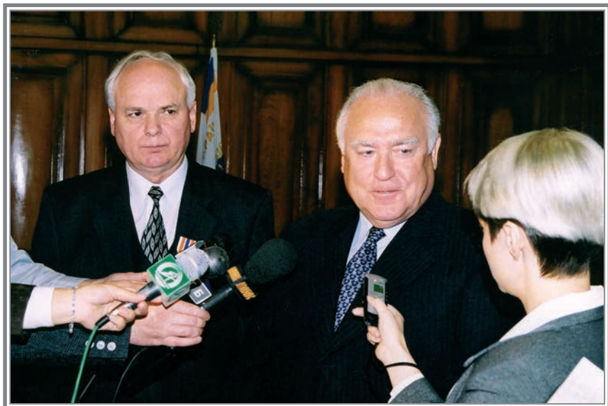
Зустріч з журналістами після завершення переговорів