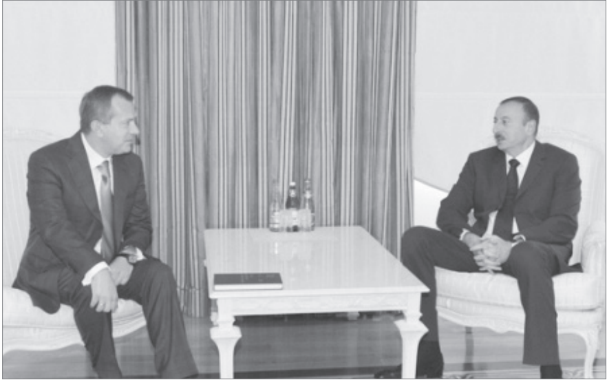
Секретар РНБОУ Андрій Ключев подарував книгу «Лідер двох епох» Президенту Азербайджану Ільхаму Алієву NSDC Secretary Andriy Kliuev presented the book «Leader of the two epochs» to President of Azerbaijan Ilham Aliyev

У презентованому виданні значне місце відведено також азербайджансько-українським відносинам, взаємовпливу двох яскравих національних культур, пошуку спільних інтересів у політиці та економіці.