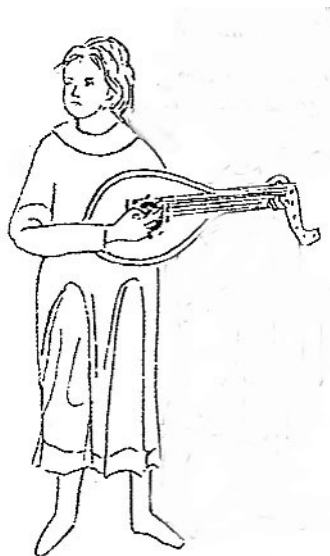
Рис. 3. Лютня з фрески «Музиканти і скоморохи» з каплиці Св. Трійці (Люблін, Польща, 1418 р.)