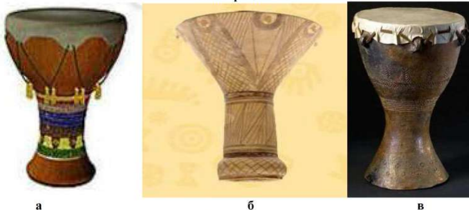
Рис. 1. Археологічні барабани келихоподібної форми (3600–1290 рр. до н.е.): а – Єгипет; б – Китай; в – Чехія