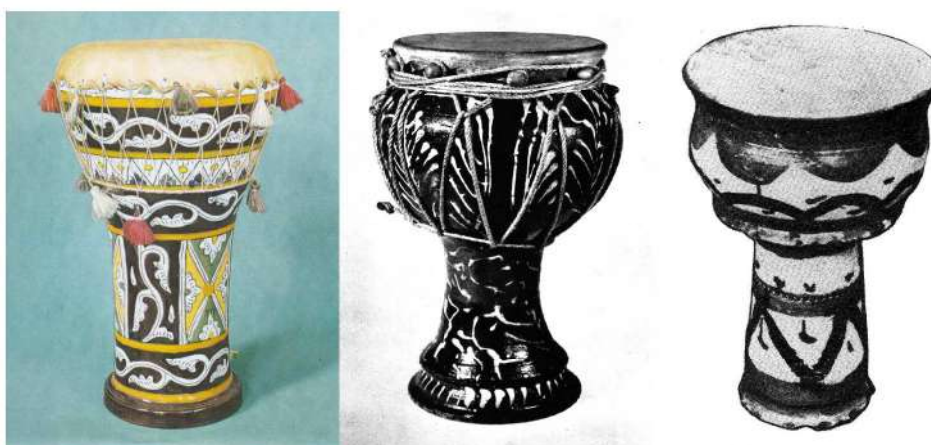
Рис. 2. Сучасні народні барабани келихоподібної форми