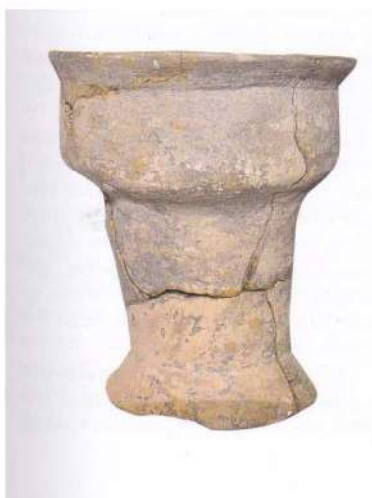
Рис. 3. Трипільський барабан келихоподібної форми (4600 р. до н.е.)