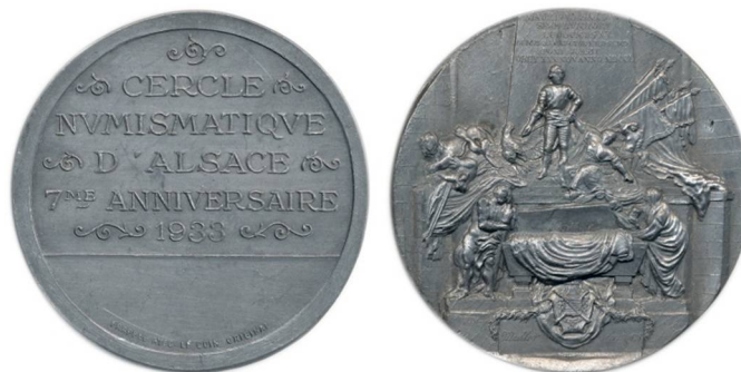
Рис. 4. Свинцовая медаль 1933 г. в честь седьмого юбилея общества нумизматов Эльзаса с повторением реверса медали с изображением саркофага Морица Саксонского

Существует медаль 1933 г. диаметра 60 мм с курсивной легендой на реверсе “Müller fecit 1828” (рис. 4). Эта легенда дает дату исполнения штемпеля реверса одним из медальеров – Мюллером (рис. 3). Вероятно,