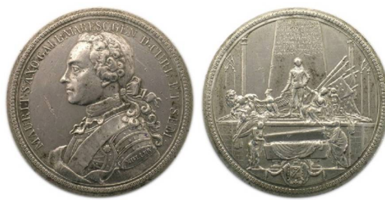
Рис. 3. Медаль с изображением саркофага Морица Саксонского, диаметр 55 мм – подпись гравера Müller

Литературные источники называют имена трех медальеров: “Kamm, Müller et Daumy”, размер от 50 до 53 мм и в качестве материалов – бронзу и свинец (рис. 2-3) 4 . Отмечена также медаль диаметра 55 мм из олова 5 .