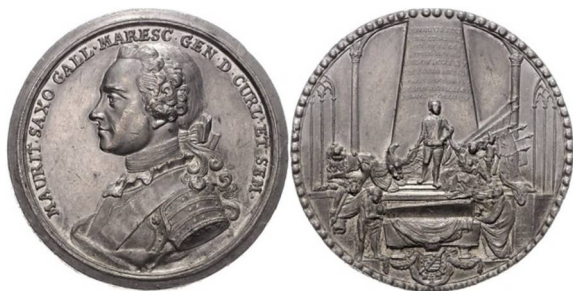
Рис. 2. Оловянная медаль с изображением саркофага Морица Саксонского, диаметр 56 мм – подпись гравера Кам

Rv.: MAURITIO SAXO / CURL ET SEMIGAL / DUCI SURE EXTUR/ SEMPER VICTOR / LUDOVICUS XV / VICTORIA AUCTOR / ET IPSE DUX PONI JUSSIE / CAMBORITI XXX NOV A MDCCL ÆTATIS LV, надгробный памятник.