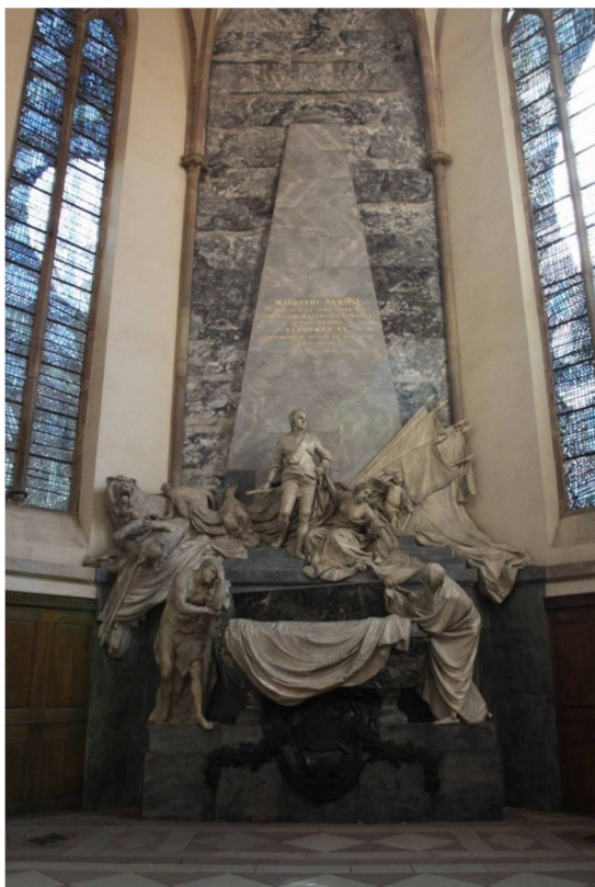
Рис. 5. Саркофаг Морица Саксонского в кирхе Сен-Тома г. Страсбурга (Франция)

В коллекции исторических и коммеморативных медалей Бенджамина Вайса имеется битая бронзовая медаль с легендой в экзерге NUM. SIGN. A. MDCCXLVII KAL. DECEM. (декабрьские календы 1747 г.) с бюстом Морица Саксонского вправо с надписью под обрезом плеча I.D. ET FIELS F. – “Жан Дассье и сын резали” (Jean Dassier, Jacques-Antoine Dassier). Диаметр медали 54 мм (рис. 6) 3 .