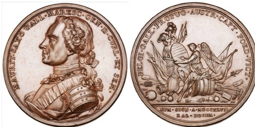
Рис. 7. Бронзовая медаль 1747 г. с бюстом Морица Саксонского влево, диаметр 54 мм

Американскому нумизматическому обществу принадлежит другая битая бронзовая медаль тех же авторов с бюстом Морица Саксонского влево с надписью на обресе предплечья I. D. ET F. – “Жан Дасье и сын” (Jean Dassier Jacques-Antoine Dassier) с идентичным реверсом. Диаметр медали 54 мм, вес 67,5 г (рис. 7). Такая же частично позолоченная медаль принадлежит нью-йоркскому музею “Метрополитен” (Metropolitan Museum of Art, 36.110.42). Исходя из времени жизни Жана Дасье (1676–1763) и его сына Жака Антуана Дасье (1715–1759) 1 , надо полагать, что им принадлежит первенство в создании медальерного бюста Морица Саксонского.