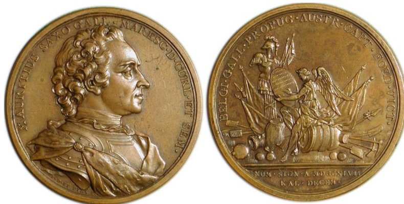
Рис. 6. Бронзовая медаль 1747 г. с бюстом Морица Саксонского вправо, диаметр 54 мм