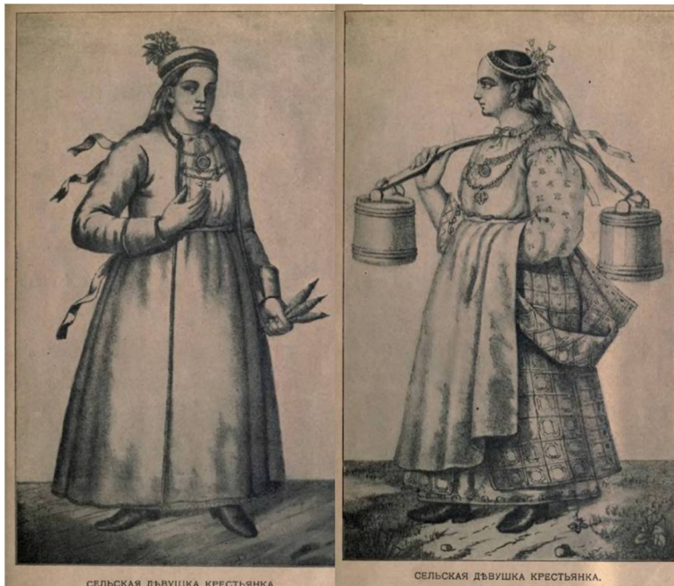
Рис. 8. Дукач в наряде сельских украинских девушек (по Ефименко А. Я.)

Дукачи, как предмет не массового ремесленного производства, встречаются довольно редко (рис. 8) 2 . Они могли делаться как из оригинальных монет и медалей, так и из литых или штампованных копий точно или частично повторяющих оригинал. Например, дукач из талера Марии Терезии 1750 г. хранится в Тракайском историческом музее 3 . Позолоченный дукач 18 в. из отливок (материал не указан) по образцу двух различных российских медалей находится в собрании Государственного Эрмитажа 4 .