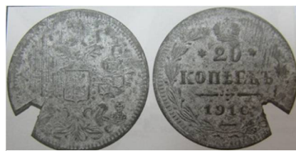
Рис. 8. Фальшиві 20 копійок з датою «1916» із погашенням.

Зразки фальшивих монет та банкнот, які є німими свідками подій Першої світової війни відомі і на колекційному ринку. Відомий нумізматичний аукціон «Gabinet Numismatyczny D.Marciniak» декілька разів виставляв у продаж підробки: