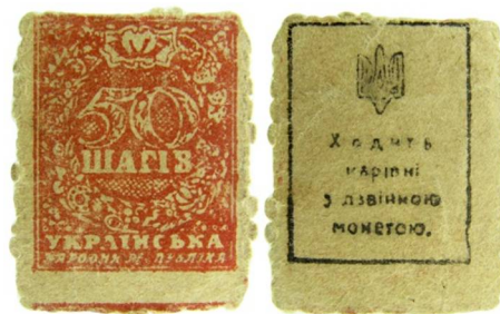
Рис. 16. Тогочасна підробка 50 шагів.

Таким чином, підсумовуючи проведені дослідження, можна зробити висновок про те, що в Україні у роки Першої світової війни практично всі грошові знаки, які перебували грошовому обігу підроблялись приватними особами з метою незаконного прибутку. Також в Україні набули поширення фальсифікати російських грошей, виготовлених у Німеччині та Австро-Угорщині у якості економічної диверсії стосовно Російської імперії. В останній рік Великої війни в Україні набули широкого поширення підробки грошей, емітованих українськими урядами.