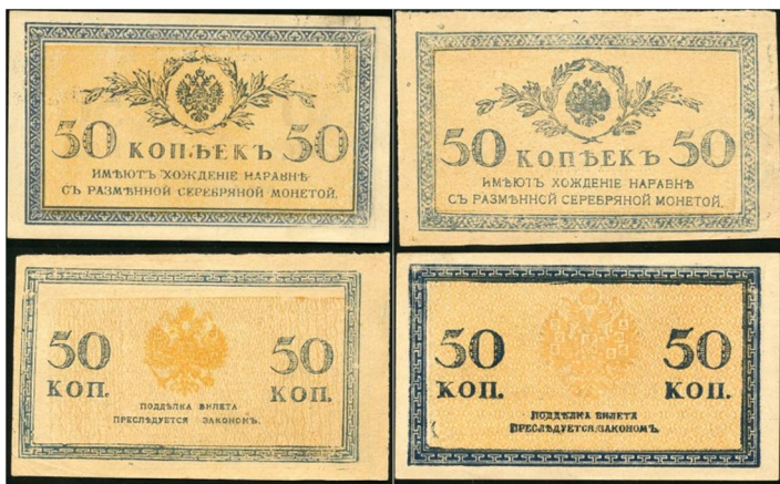
Рис. 4. Підробки для обігу казначейських знаків 50 копійок 1915 р.

Підробки вищезгаданих казначейських знаків нам вдалося зафіксувати у приватних колекціях в м. Києві (Рис. 4), а факти їх фальсифікації оприлюднила на своїй сторінці газета «Крымский Вестник» від 8 травня 1916 року: «Поддельные боны. В молочную лавку в Новой Деревне в Петрограде вошли двое неизвестных, которые, купив хлеба, дали в уплату 50-копеечный бон. Рассматривая деньги, приказчик заметил несоответствие их с действительными бонами. Едва неизвестные вышли из лавки, приказчик, бросившись за ними, задержал их и доставил в участок. При обыске у них была обнаружена пачка поддельных 50-копеечных бонов. Чины сыскной полиции отправились на квартиру неизвестных и обнаружили целую организацию, занимающуюся подделкой бумажных бонов. Все арестованные в числе пяти человек были доставлены в сыскную полицию» 1 . Порівнюючи вивчені підробки казначейських знаків із оригінальними, що зберігаються в колекції Національного музею історії України (Рис. 5) 2 , можна виявити суттєві відмінності в якості паперу, нанесених фарб, відхилення в дрібних деталях малюнка, особливо малого герба Російської імперії, а також цифр позначення номіналу.