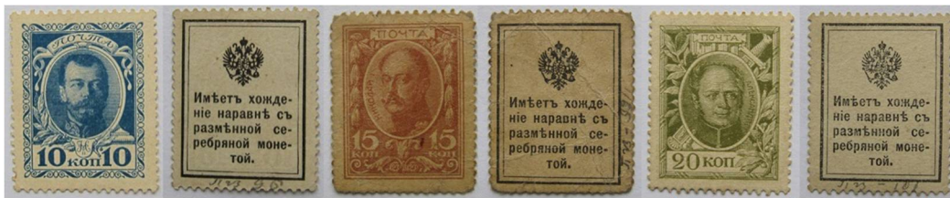
Рис. 1. Розмінні марки замість срібних російських монет. 10 копійок 6 , 15 копійок 7 та 20 копійок 8 .

Вже 29 вересня 1915 р. було опубліковано відповідне розпорядження Міністра фінансів: «О выпуске в обращение разменных марок» 4 , в якому згадувалось про випуск не лише розмінних марок номіналом 20, 15 та 10 копійок замість срібних монет (Рис. 1), а також і номіналів 3, 2 та 1 копійка замість мідних (Рис. 2). На виконання цього розпорядження від 18 листопада 1915 р. Державний Банк (відділ кредитних білетів) розіслав всім своїм конторам та відділенням лист № 55/а під грифом «таємно» – «О разменных марках 1, 2 и 3 коп. дост. На случай выпуска их в обращение наравне с медной монетой» 5 .