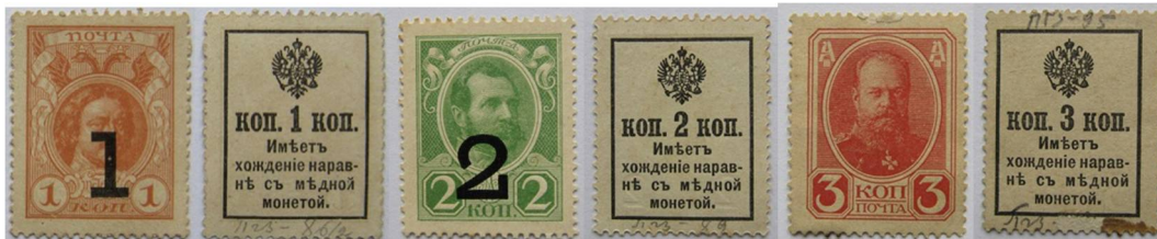
Рис. 2. Розмінні марки замість мідних російських монет. 1 копійка із наддруком «1» 9 , 2 копійки із наддруком «2» 10 , 3 копійки 11 .

Розмінні марки виготовлялись з міцного картону типографським методом із подальшим нанесенням зубцювання за допомогою перфораційної машини. Майже повна відсутність засобів захисту від підробок створювала сприятливі умови для приватних осіб щодо виготовлення їх підробок.