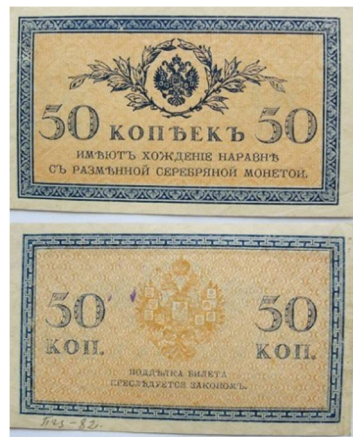
Рис. 5. Російська імперія, 50 копійок 1915 року.

Ще напередодні Першої світової війни гроші майбутнього супротивника – Російської імперії, виготовлялись у Німеччині та Австро-Угорщині. Міністр Юстицій Щегловітов повідомляв у листі директору Департаменту поліції Джунковському про те, що «...получили распространение государственные кредитные билеты 500-рублевого достоинства, отпечатанные на специально приготовленной бумаге с водяным знаком, тем самым способом, который применялся исключительно Экспедицией заготовления государственных бумаг и считался до сих пор безусловно обеспечивающим государственные кредитные билеты от подделок» 3 .