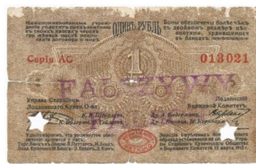
Рис. 11. Фальшивий рубль міста Лодзь, 1915 рік.

У колекції Державного Ермітажу наявний фальшивий кредитний білет номіналом 10 рублів 1909 року, на поле якого