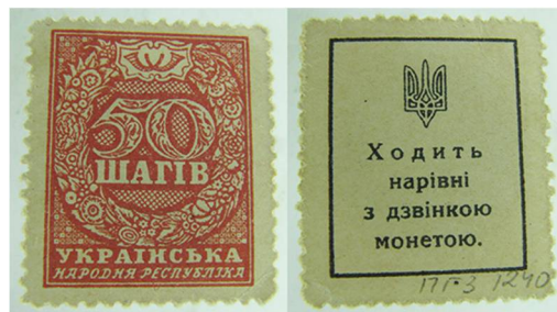
Рис. 14. 50 шагів 1918 року державного друку. м. Київ, «Типографія В. С. Кульженка».

Як відомо, популярні серед населення грошові знаки неодмінно стають зразками для фальшування. Відомим українським боністом Дмитром Харітоновим у складеному каталозі-ціннику українських паперових грошей вказано про існування тогочасних підробок грошей у вигляді поштових марок номіналом 50 шагів, причому оцінка підробок подана навіть нижча у колекційному стані за оригінальні марки із перфорацією 2 . Це свідчить про те, що відповідно до спостережень упорядника каталогу, тогочасні підробки цих марок трапляються сьогодні у приватних та музейних колекціях чи не частіше за зразки державного виробництва.