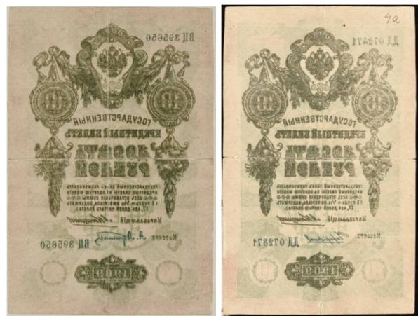
Рис. 6. Фальшивий кредитний білет вартістю 10 рублів випуску 1909 року.

Із зростанням витрат на ведення війни, потреба у грошовій масі стрімко збільшувалась, що спонукало уряд Російської імперії до суттєвого збільшення емісії паперових грошей, які повністю заповнили грошовий обіг.