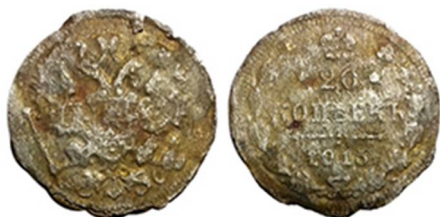
Рис. 12. Підробка монети 15 копійок 1915 року. Знайдено у Полтавській області, вага 1,79 грама, виготовлена методом покриття тонким шаром срібної фольги.

наводячи приклади фактів підробки рублевих монет, зафіксованих в архівах та дореволюційних газетах, А. Бойко-Гагарін зафіксував факти підробки грошей протягом всього часу правління останнього російського монарха 1 .