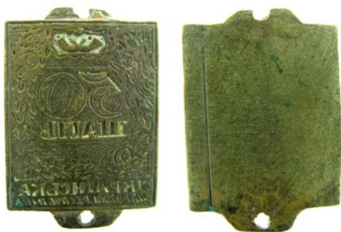
Рис. 15. Друкарське кліше для підробки розмінних марок номіналом 50 шагів. Знайдено в околицях міста Кам'янець-Подільський. Приватне зібрання м. Вишгород.

У контексті свідчень С. Шрамченка про часте виявлення підроблених грошей у вигляді марок номіналом у 50 шагів в околицях Кам'янця-Подільського, особливо цікавою є половина друкарської матриці, випадково знайденої місцевими краєзнавцями в тому ж районі (Рис. 15). Вага матриці – 10,5 грама, розмір – 23 / 34 міліметрів. Виготовлена з металу жовтого кольору, імовірно за все – бронзи. Робоча сторона матриці містить гравійоване гострими інструментами (різцями, штихелями) зображення, що з високим ступенем передає малюнок марки номіналом у 50 шагів. Враховуючи те, що другу половину матриці знайдено не було, ми не можемо виключати, що нею виготовлялись фальшиві саме поштові марки, а не гроші. Але враховуючи те, що марки номінальною вартістю 50 шагів найчастіше слугували для фальшивомонетників прототипом для підробки, можна із високим ступенем імовірності стверджувати, що даний інструмент використовувався для підробки грошей. При візуальному огляді видно, що зображення рослинних орнаментів має суттєві розбіжності із малюнками орнаментів на марках державного виробництва, нерівною є висота літер. Верхня та нижня бокові частини матриці мають вушка із отворами, якими здійснювалось з'єднання половин матриці між собою. Вушко у верхній частині пошкоджене. Скоріше за все, друга половина цього агрегату фальшивомонетників мала аналогічні засоби кріплення, що з'єднувалися між собою гвинтами. Написи на робочій