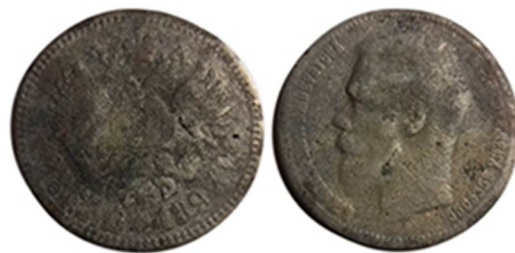
Рис. 13. Підробка монети 1 рубль 1897 року. Знайдено у Львівській області, вага 16,51 грама, виготовлено з олова. Приватна колекція, м. Київ.