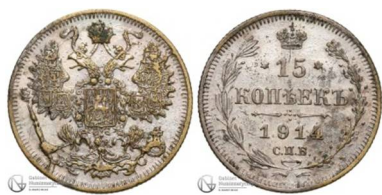
Рис. 9. Фальшиві 15 копійок 1914 року. Вага: 2,53 г.

15 копійок 1914 року (Рис. 9) 1 , 50 польських марок 1916 року (Рис. 10) 2 , а також фальшивий рубль для міста Лодзь 1915 року (Рис. 11) 3 .