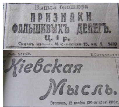
Рис. 17. Повідомлення про випуск спеціальної брошури із методикою розпізнавання фальшивих грошей. Газета «Киевская мысль», 1918 рік.