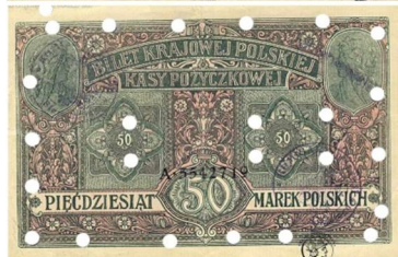
Рис. 10. Фальшиві 50 марок 1917 року, Регентське королівство Польське