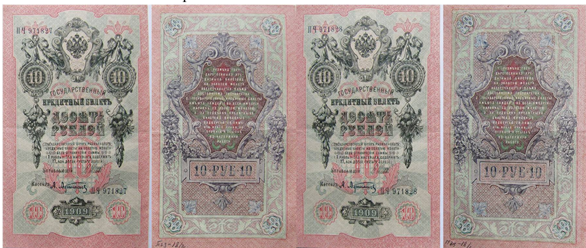
Рис. 7. Російська імперія, 10 рублів 1909 р., ПЧ 971828 4 , ПЧ 971827 5