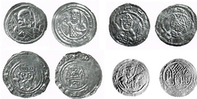
Рис. 6. Монети балтійських слов'ян XII ст.: брактеати Якси Копаницького (Jaxavon Kōrepick), середина XII ст.; денарії Прибислава-Генріха, до 1150 р.; денарії Яромара Рюгенського кінець XII ст.-початок XIII ст.