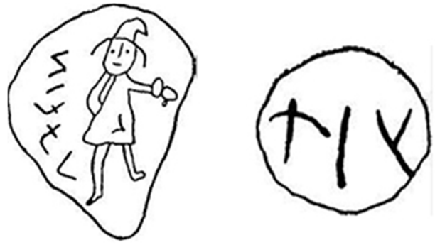
Рис. 4. Каміні №9 та № 10 з рунами з Ной-Штреліца.