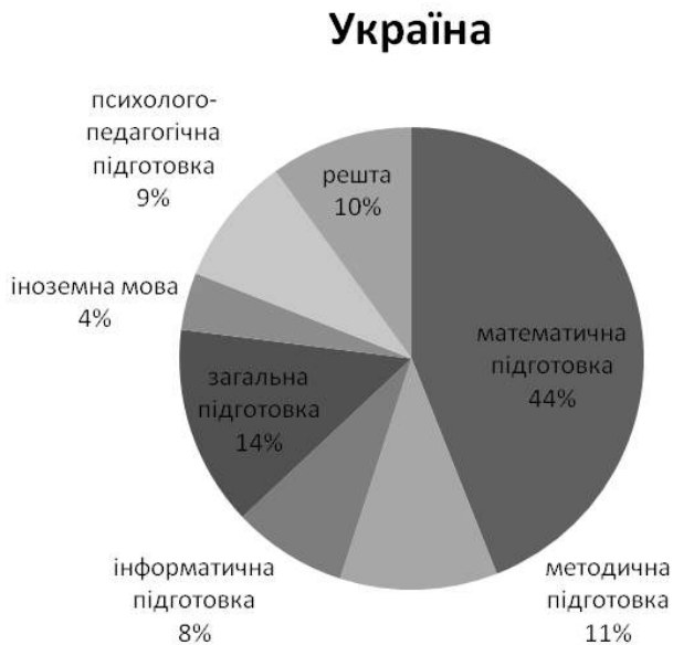
Рис. 3. Розподіл предметів у навчальному плані підготовки вчителя математики у Національному педагогічному університеті імені М. П. Драгоманова