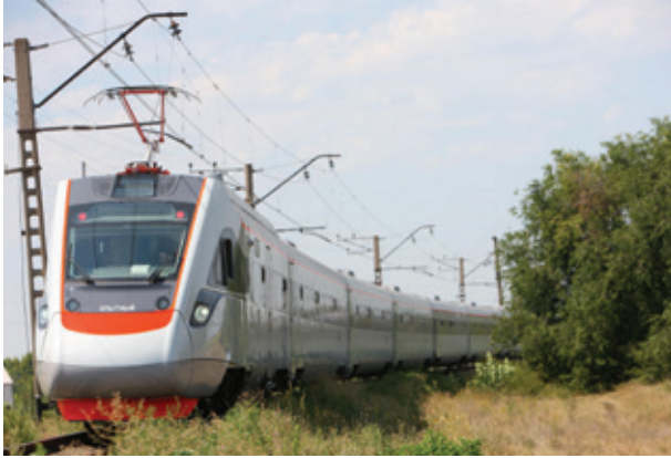
Проведення випробувань двосистемних електропоїздів виробництва ПАТ «Крюківський вагонобудівний завод» зі швидкістю до 200 км/год