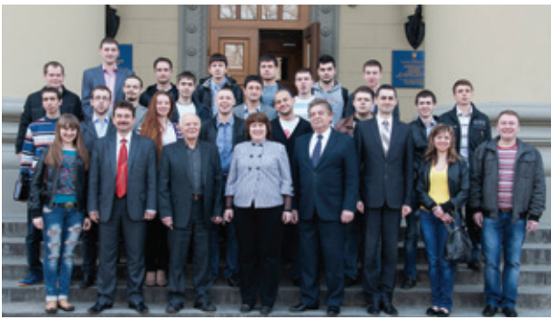
Фіналісти та організатори II туру Міжнародної студентської олімпіади по «Мостам»