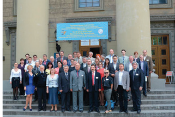
Учасники пленарного засідання 74-ї Міжнародної науково-практичної конференції «Проблеми та перспективи розвитку залізничного транспорту»