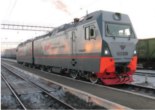
Проведення сертифікаційних випробувань локомотива «ГРАНІТ» – 2ЕС10 (Російська Федерація)