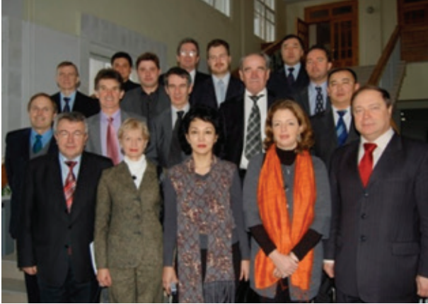
Учасники міжнародної зустрічі за програмою Tempus у ДІІТ (SNCF, PKP, UZ, ДІІТ)