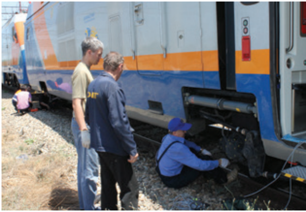
Проведення випробувань пасажирського поїзда «Тулпар-Тальго» (Іспанія) для Республіки Казахстан при швидкостях до 220 км/год