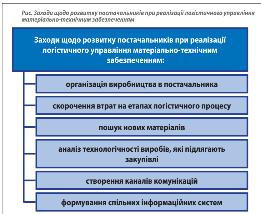
Рис. Заходи щодо розвитку постачальників при реалізації логістичного управління матеріально-технічним забезпеченням

Першочерговим завданням удосконалення матеріально-технічного забезпечення на основі встановлення сучасних логістичних принципів