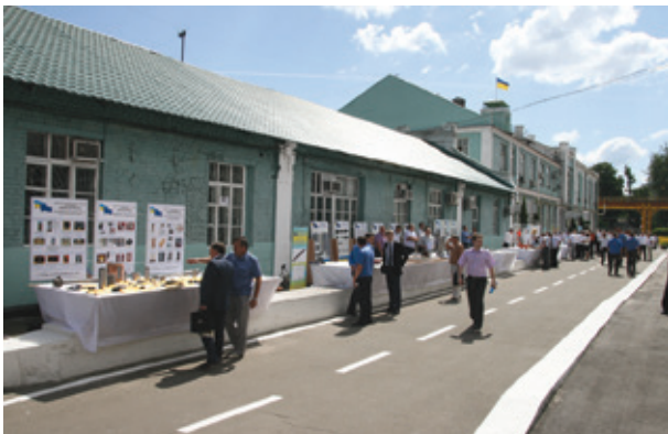
Реалізація виробничого потенціалу — ознака бережливого виробництва