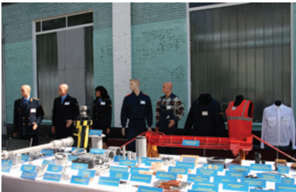
Експозиція продукції структурних підрозділів локомотивної служби