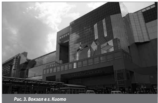
Рис. 3. Вокзал в г. Киото