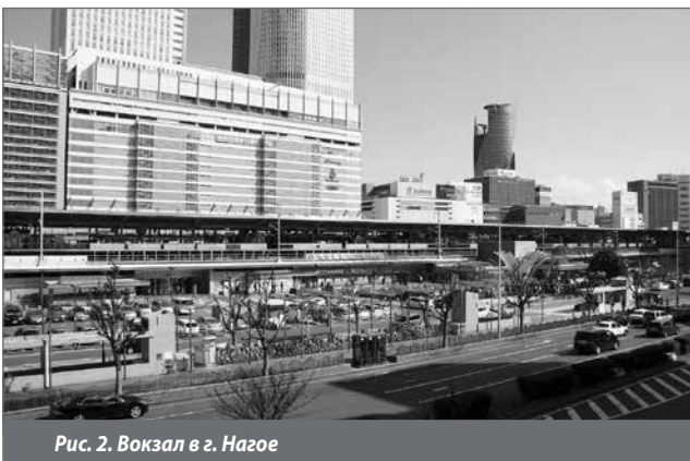
Рис. 2. Вокзал в г. Нагое

Наиболее перспективным направлением является мультимодальность — сочетание железнодорожного, авто- и авиатранспорта с внутренним городским авто-, вело- и электротранспортом. Этим фактором определяется наличие технического оснащения и реконструкция тупиковых вокзалов в руслоты с размещением здания или над транспортными коммуникациями и платформами, или под ними. Также технологические требования должны учитывать гибкость проектных решений, возможность увеличения площади или этажности, размещение современного оборудования с учетом перспективного развития МКК. При разработке объемно-планировочных решений, с учетом системообразующих факторов, помещения будут размещаться по группам, с ориентацией на потребителя данного вида услуг. Поэтому группировка помещений, как отмечает А. Гельфонд [11], применима при проверке необходимого минимального состава помещений. При представлении здания служебно-технического назначения как многоуровневой системы необходимо представлять группы помещений по принципу структурной упорядоченности с иерархией подтипов. Для этого необходимо определить элементы такой системы, как МКК, ее связи и иерархию. Определяя иерархию, определяем подсистему с системообразующей функцией, которая оказывает направляющее воздействие на нижележащий уровень. Это воздействие проявляется в том, что подчиненные члены иерархии приобретают новые свойства, отсут-