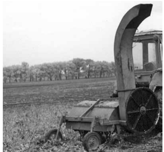
Рис. 2. Гичкозбиральна машина 3-рядного виконання, яка фронтально навішена на колісний трактор і здійснює суцільний зріз основного масиву гички

гички III має встановлені на рамі 7 очищувальні вали 9 (індивідуальні для кожного рядка посівів буряків цукрових очищувальні робочі органи), що мають вертикальні осі обертання і містять консольно закріплені на кінцях еластичні очисні лопаті. Еластичні очисні лопаті вала 9, рухаючись поступально по рядку масиву коренеплодів буряків цукрових на встановлений за допомогою копіювальних коліс 10