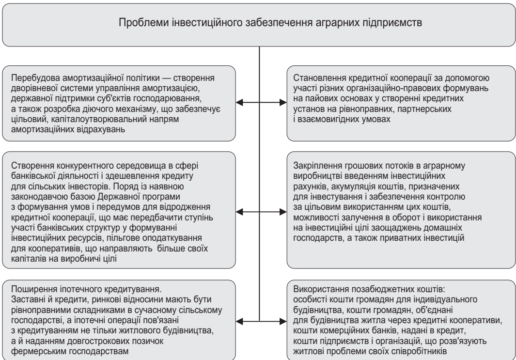
Рис. 3. Проблеми інвестиційного забезпечення аграрних підприємств області

У сільському господарстві Закарпатської обл. обсяги інвестицій в основний капітал прямо залежать від обсягів виробництва сільськогосподарської продукції.