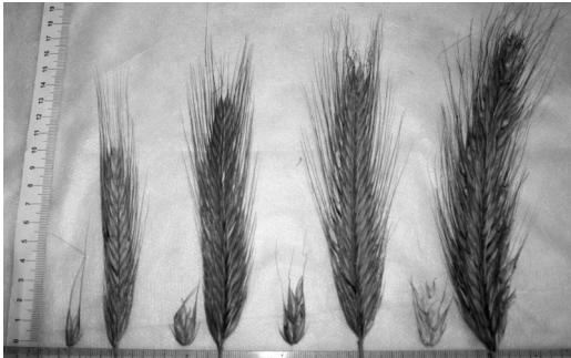
Рис. 2. Двоквіткові, триквіткові, чотириквіткові та п'ятиквіткові колоси жита озимого