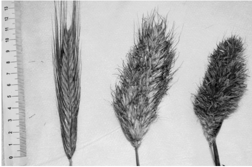
Рис. 1. Двоквіткове (звичайне) жито озиме та багатоквіткові різновидності S. compositum Lam. та S. monstrosus Koern.

Secale cereale L. — Secale vulgare Koern. → Secale triflorum P. Beavn. → Secale tetraflorum → Secale pentaflorum → Secale var. compositum Lam. → Secale var. monstrosus Koern. Нами було відібрано та проаналізовано зразки, які належать до всіх відомих форм. На рис. 1 показано варіанти з мінімальною та максимальною