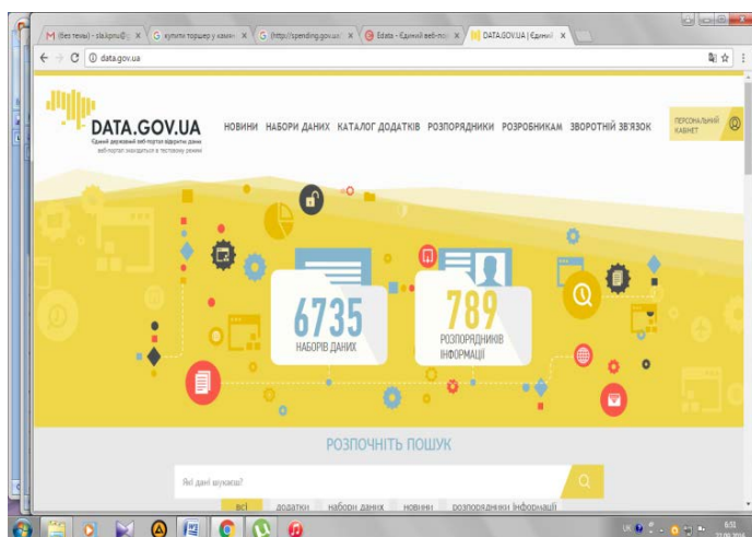
Єдиний державний веб-портал відкритих даних http://data.gov.ua