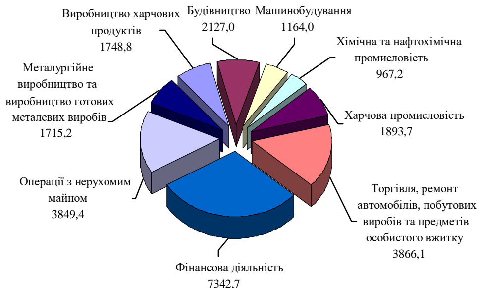
Рис. 2. ПІІ в Україні за основними видами економічної діяльності на 01.10.2008 (у млн. дол. США до загального обсягу інвестування)

Маючи доступ до недорогих іноземних фінансових ресурсів, порівняно з внутрішніми, банки можуть заробляти великі суми саме на різниці закордонних та національних відсоткових ставок. Наприклад, на національному ринку відсотки за користування кредитами в іноземній валюті на середину січня 2009 р. в середньому по банках України становили 10,2 % [3], а в розвинених країнах світу – близько 5 %.