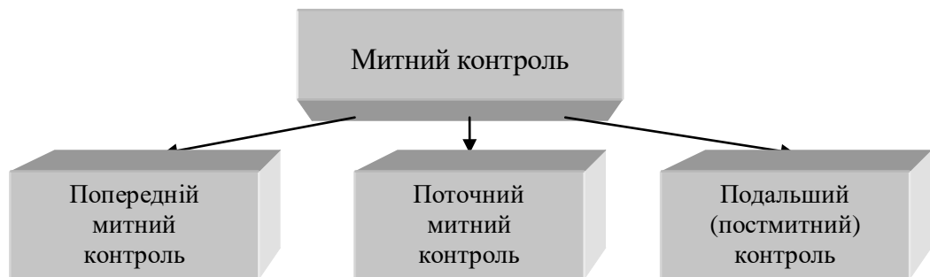
Рис. 1. Етапи митного контролю

До основних завдань митної служби України, передбачених законодавством нашої країни, належить організація та проведення митного контролю під час перетину кордону товарів і транспортних засобів. Однією з форм митного контролю, закріплених Митним кодексом України, є “перевірки системи звітності та обліку товарів, що переміщуються через митний кордон України, а також своєчасності, достовірності, повноти нарахування та сплати податків і зборів, які відповідно до законів справляються при переміщенні товарів через митний кордон України” [5, 29], що стають можливими у період подальшого контролю, а саме у формі постмитного контролю (рис. 1).