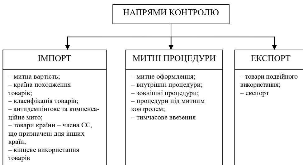
Рис. 2. Структура сфер митного контролю в країнах ЄС

Вступ України до СОТ потребує вдосконалення системи контролю за підприємницькою зовнішньоекономічною діяльністю відповідно до вимог ЄС. У країнах ЄС існує три напрями контролю: імпорт, митні процедури та експорт, кожен з яких поділяється на підгрупи (рис. 2).