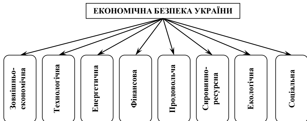
Рис. 1. Пріоритетні складові економічної безпеки України

складових економічної безпеки побудована на доопрацюванні роботи [3] з додаванням таких важливих складових, як екологічна та соціальна, що відображують сучасне розуміння пріоритетів розвитку соціально орієнтованої економіки.