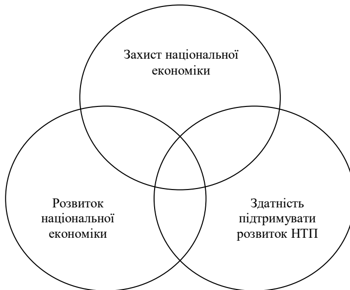
Рис. 2. Складові розвитку економічної безпеки

них процесів інтеграції на економічне зростання важливо використати такі фактори державного регулювання, як вплив на пропорції інвестицій у різні галузі національної економіки, на розвиток інфраструктури, на освіту й науку. Причому цей перелік може постійно змінюватися з урахуванням вітчизняних економічних інтересів.